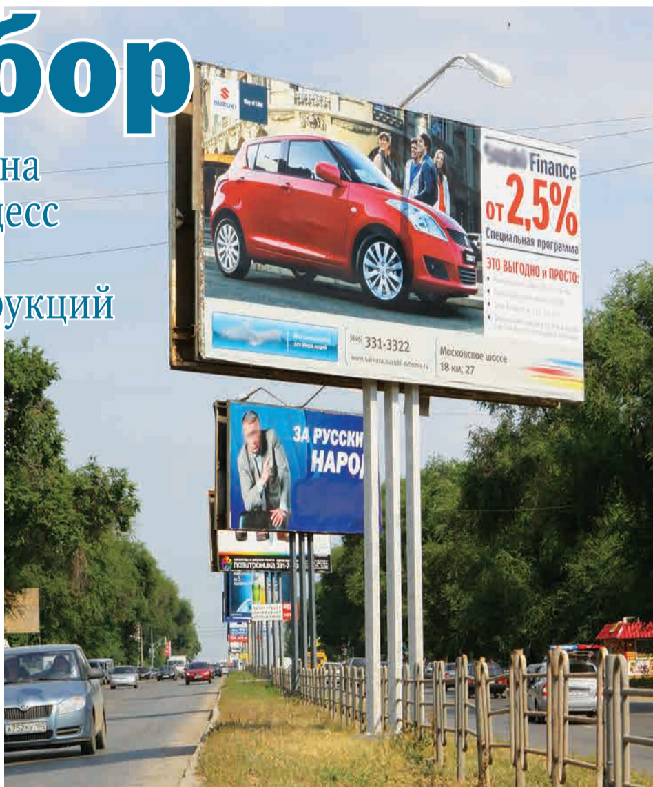
В САМАРЕ 3560 рекламных конструкций. Почти половина из них незаконна