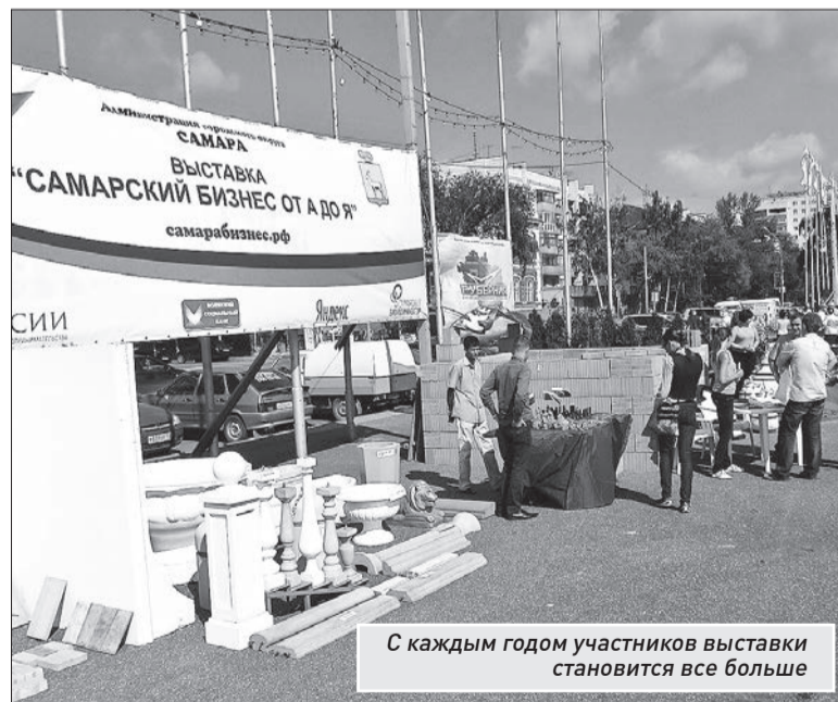
С каждым годом участников выставки становится все больше