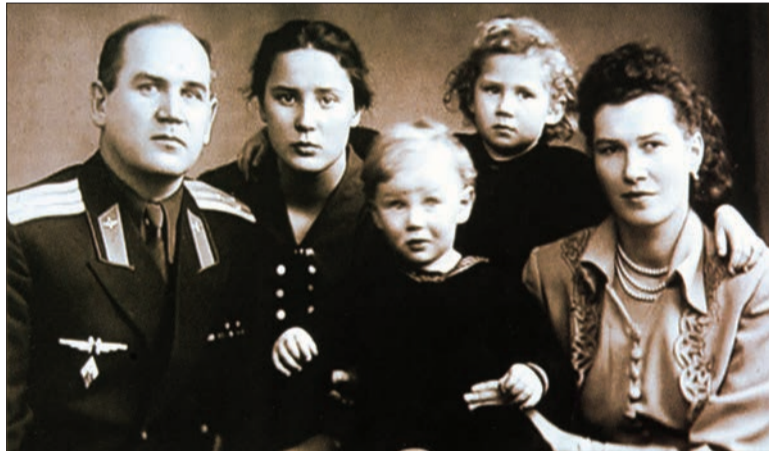
СЕМЬЯ получилась большая и дружная