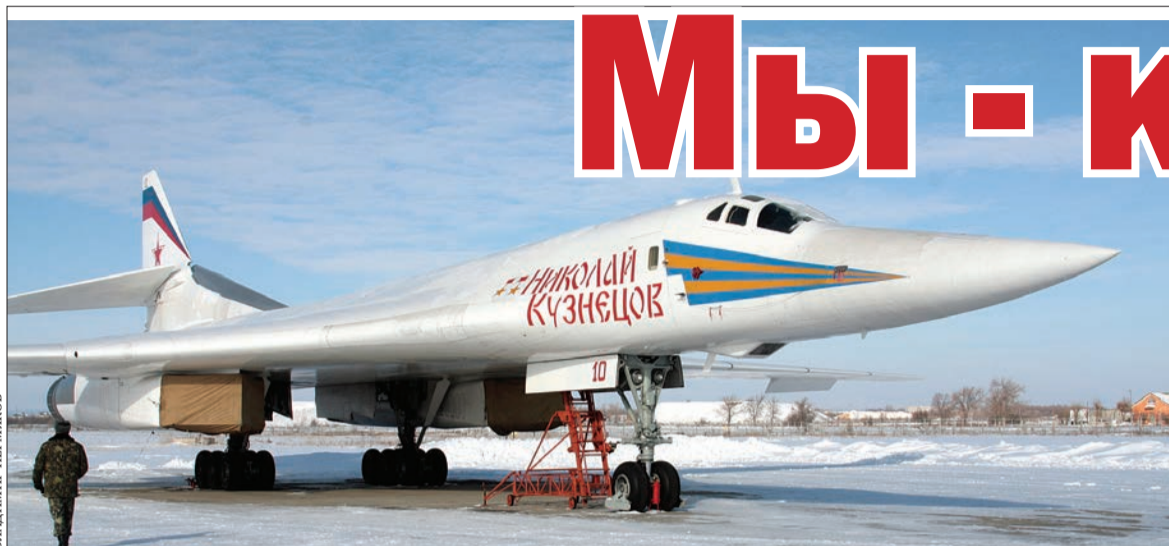
СТРАТЕГИЧЕСКИЙ ракетоносец Ту-160