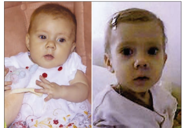
ДО БОЛЕЗНИ и после