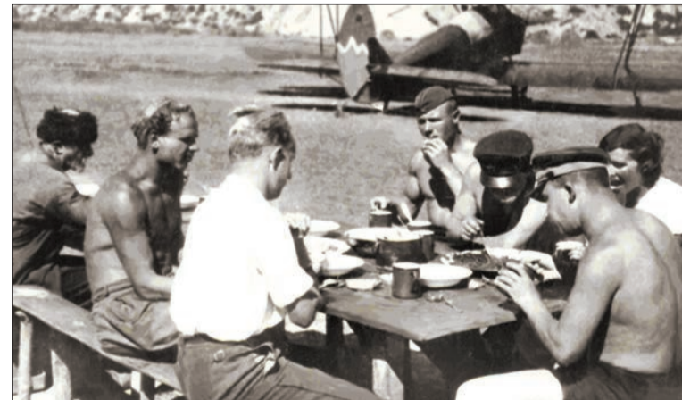
КУРСАНТЫ летной школы академии