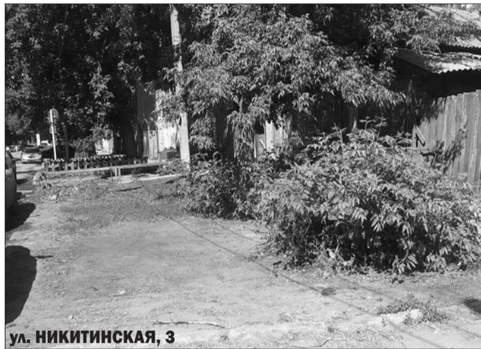
ул. НИКИТИНСКАЯ, 3

Многие горожане с помощью нашей газеты уже обратили внимание ответственных лиц на проблемы благоустройства. Результат не заставил себя ждать: на некоторых территориях стало чище.