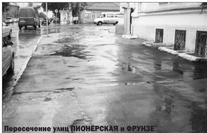
Пересечение улиц ПИОНЕРСКАЯ и ФРУНЗЕ