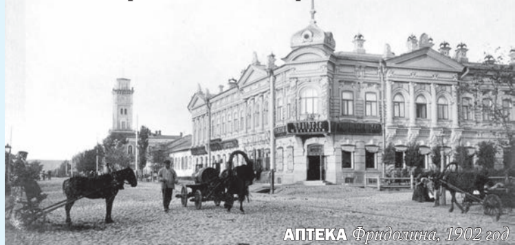
АПТЕКА Фридриха, 1902 год