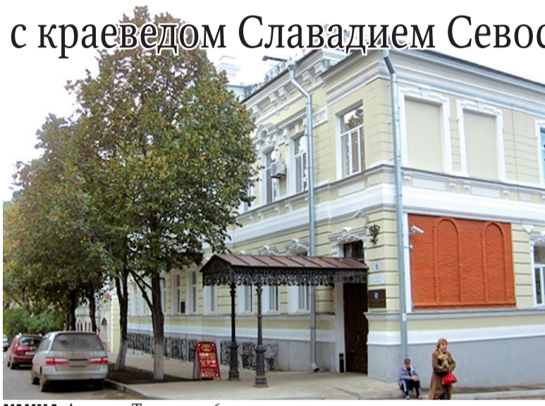
УЛИЦА Алексея Толстого, 6