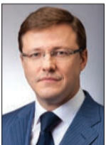
ДМИТРИЙ АЗАРОВ глава Самары:

- Набережная станет местом комфортного отдыха. Здесь будут усилены меры безопасности, ограничено распитие спиртных напитков в тех местах, которые для этого не предназначены. Обновленная набережная будет одной из красивейших рекреационных зон Самары, достопримечательностью, которая привлечет не только горожан, но и туристов.