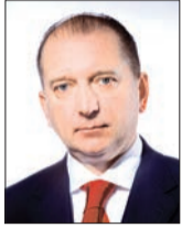
ВЛАДИМИР АРТЯКОВ губернатор Самарской области:

- Набережная станет местом комфортного отдыха. Здесь будут усилены меры безопасности, ограничено распитие спиртных напитков в тех местах, которые для этого не предназначены. Обновленная набережная будет одной из красивейших рекреационных зон Самары, достопримечательностью, которая привлечет не только горожан, но и туристов.