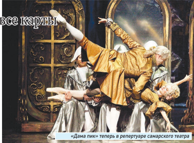
«Дама пик» теперь в репертуаре самарского театра