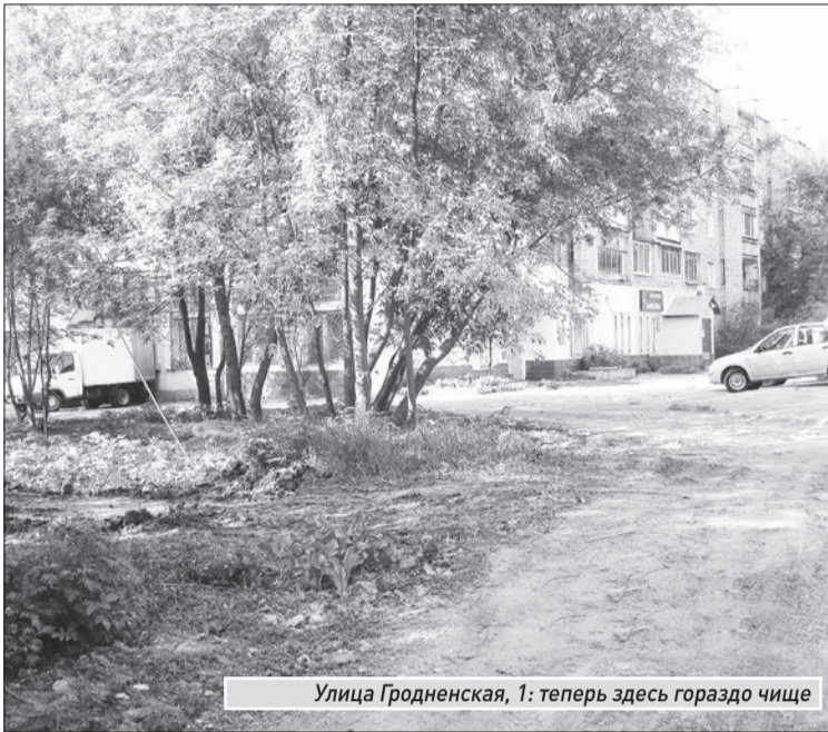
Улица Гродненская, 1: теперь здесь гораздо чище