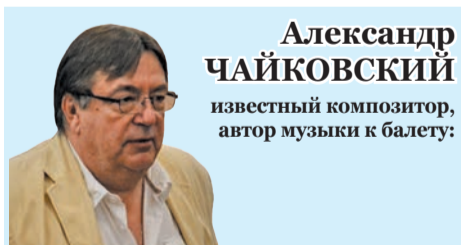
Александр ЧАЙКОВСКИЙ известный композитор, автор музыки к балету: