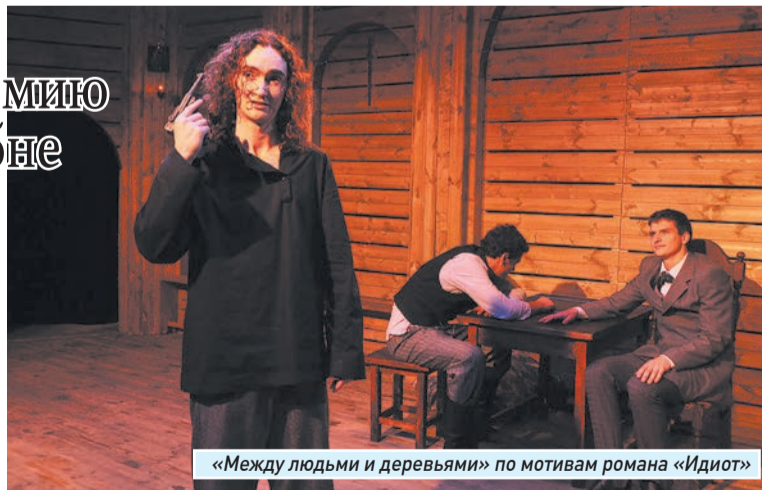
«Между людьми и деревьями» по мотивам романа «Идиот»

Жюри по традиции возглавила заведующая кабинетом критики Союза театральных деятелей, кандидат искусствоведения, за-