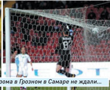
Бесславного разгрома в Грозном в Самаре не ждали...

«Терек» (Грозный) - «Крылья Советов» (Самара) 26 мая. Грозный.