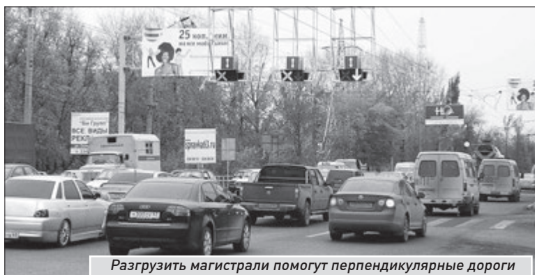
Разгрузить магистрали помогут перпендикулярные дороги

Эпидемиологическая ситуация удовлетворительная, групповой и вспышечной заболеваемости не зарегистрировано.