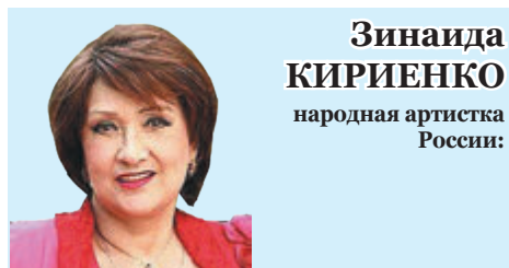
Зинаида КИРИЕНКО народная артистка России: