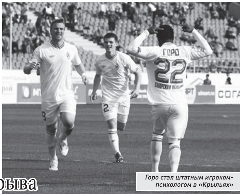
Горо стал штатным игроком-психологом в «Крыльях»

Следующую встречу самарцы проведут уже 26 апреля в Нижнем Новгороде с «Волгой».