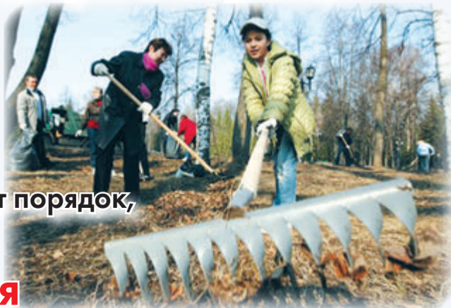
Администрация городского округа Самара