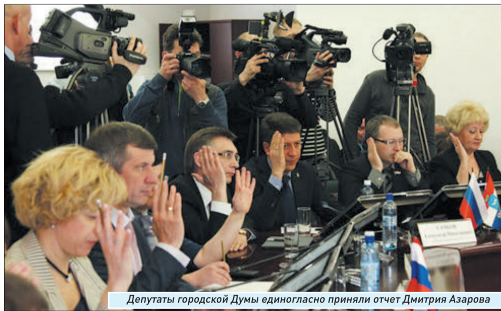
Депутаты городской Думы единогласно приняли отчет Дмитрия Азарова

- В последнее время при ликвидации незаконных объектов администрация сталкивается с противодействием криминальных структур и со стороны собственников. Проблема эта есть буквально по каждой территории. Но хочу вас заверить, что, несмотря на это, работа будет продолжена, потому что мы обязаны здесь обеспечить торжество закона. Совместно с правоохранительными органами, правительством Самарской области и при поддержке жителей мы с этой задачей, безусловно, справимся.