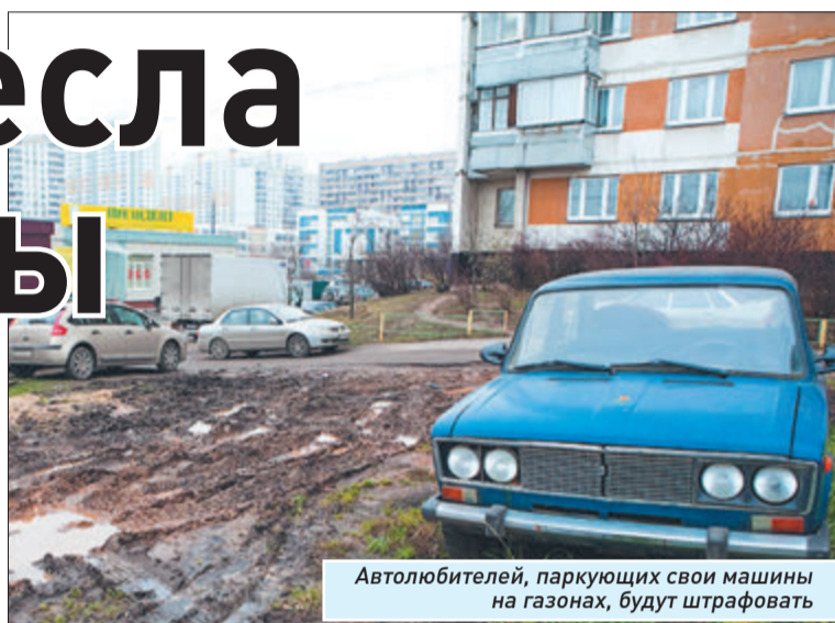
Автолюбителей, паркующих свои машины на газонах, будут штрафовать