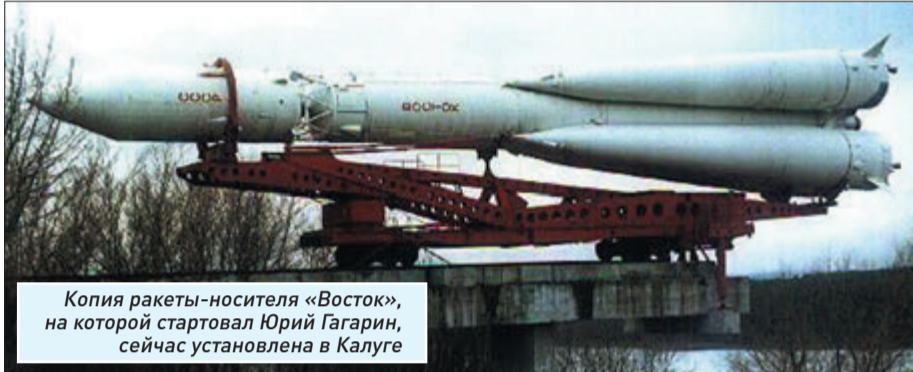
Копия ракеты-носителя «Восток», на которой стартовал Юрий Гагарин, сейчас установлена в Калуге