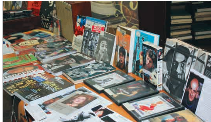
САЙТ «АЛИАНС ФРАНСЕЗ САМАРА»

- Если подойти к любому человеку на улице и спросить, с чем у него ассоциируется Франция, то еще до того, как у него сформируется хоть одна мысль, его лицо озарит улыбка. Потому что эта страна подсознательно вызывает у нас приятную реакцию. В голове возникает образ, составленный из великой французской литературы, шансона, ароматов кухни.