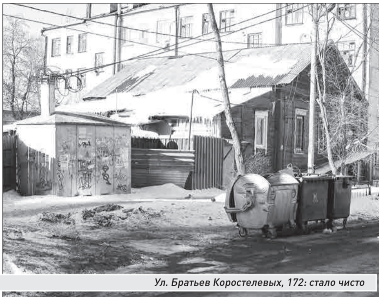
Ул. Братьев Коростелевых, 172: стало чисто