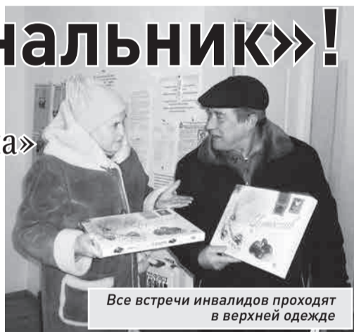
Все встречи инвалидов проходят в верхней одежде