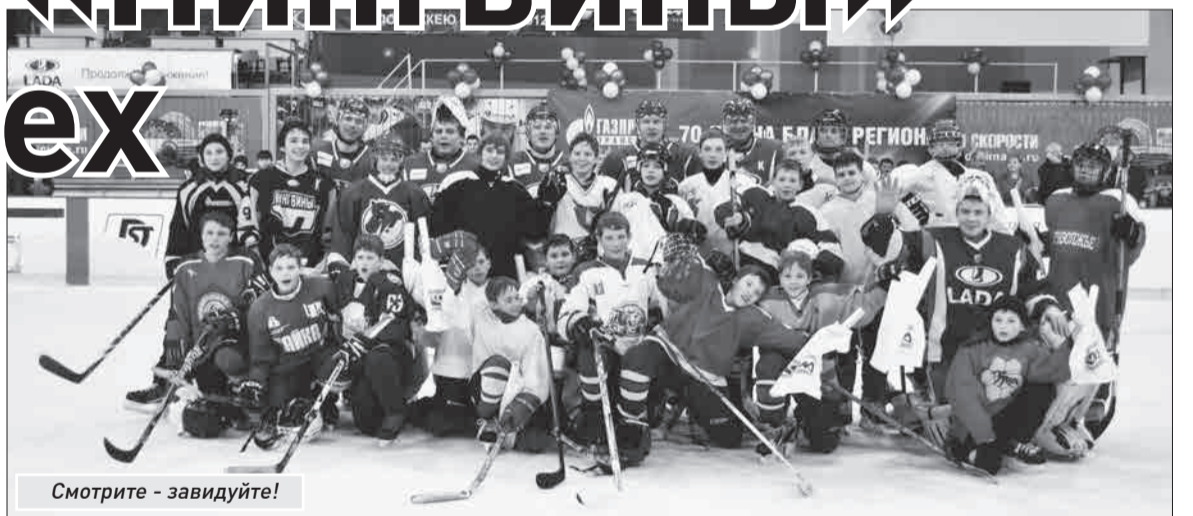
Смотрите - завидуйте!

Напомним, что областной турнир юных хоккеистов «Золотая шайба. Возрождение» стартовал в декабре 2012 года. Всего в соревнованиях приняли участие более 700 игроков, 35 команд со всей Самарской области.