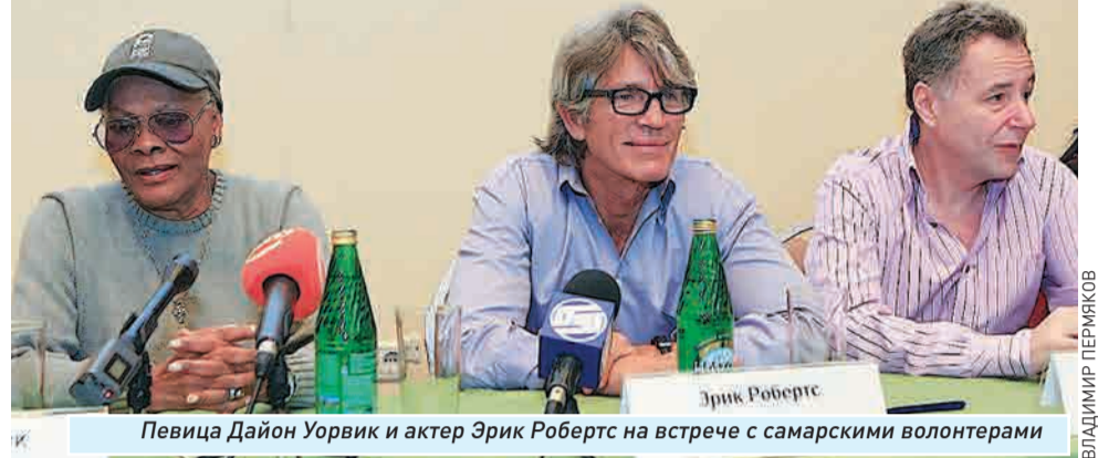
Певица Дайон Уорвик и актер Эрик Робертс на встрече с самарскими волонтерами