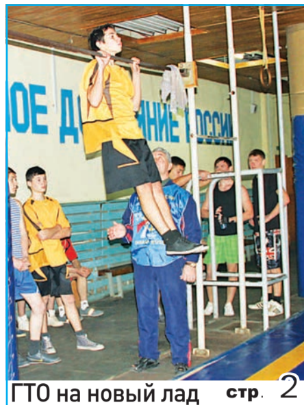
ГТО на новый лад стр. 2