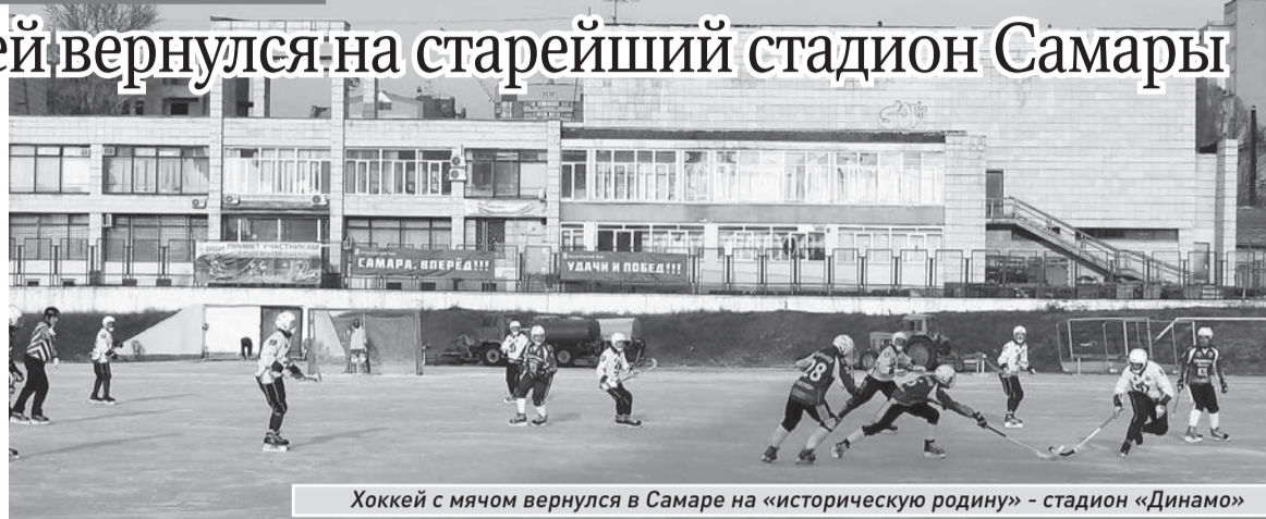
Хоккей с мячом вернулся в Самаре на «историческую родину» - стадион «Динамо»

Когда-то команда «Подшипник», которую возглавлял заслуженный тренер России Геннадий Казаков , а Долгов в ней капитанствовал, успешно защищала честь тогда еще куйбышевского хоккея в союзной высшей лиге. С развалом СССР команда стала никому не нужна и была на грани исчезновения. Первым плечо подставил капитан, взяв обременительные расходы на себя. Сколько по это-