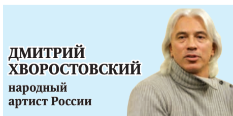
ДМИТРИЙ ХВОРОСТОВСКИЙ народный артист России