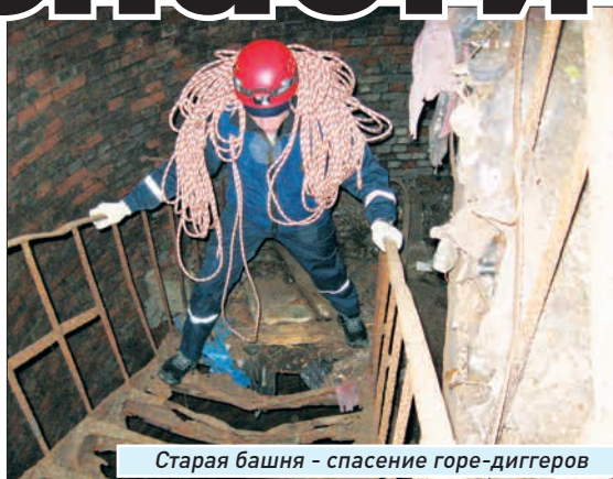
Старая башня - спасение горе-диггеров

- 27 декабря Всероссийский день спасателя, поэтому поздравляем всех наших коллег с профессиональным праздником! В год наши специалисты обрабатывают порядка 700-800 выездов. В этом году, к счастью, чрезвычайных ситуаций крупного масштаба не было. Наш совет: чтобы не попасть в чрезвычайные ситуации, нужно их по возможности предвидеть. И помнить, что если идешь по тонкому льду, то когда-нибудь провалишься, если стоишь под сосулькой - рискуешь тоже. Просто надо к себе относиться более бережно и понимать, что большой город таит в себе немало опасностей. И наблюдайте жизнь вокруг себя!