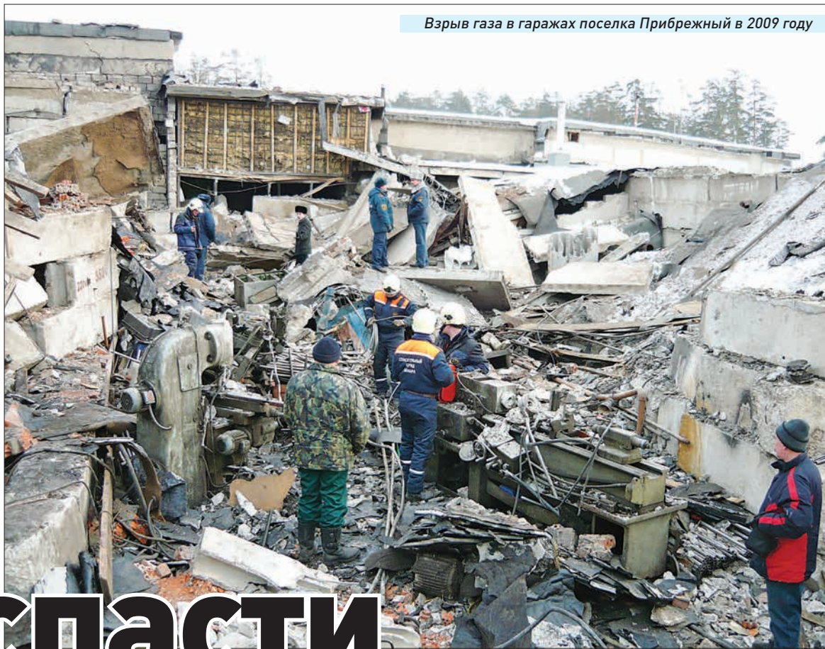
Взрыв газа в гаражах поселка Прибрежный в 2009 году

- С ним случилось все, что могло случиться... Упал, ногу сломал, к тому времени уже началось нагноение раны. Сотовый при падении тоже разбился. Но сколько мужества было у мужика! Он из оврага более ста метров наверх прополз. Обосновался на бревне и просидел там трое суток. До дороги два, а то и три километра. Лес, грязь - дожди прошли. Держался молодцом, вел себя совершенно адекватно. Как раз мы получили новые, очень удобные носилки с колесиками - УТ-2000, на которых подняли его