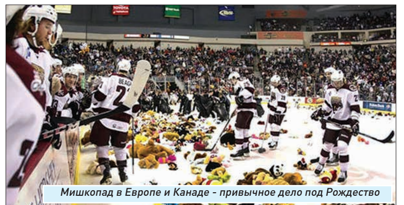
Мишкопад в Европе и Канаде - привычное дело под Рождество

«После того как прозвучит финальная сирена встречи, - говорится в обращении к болельщикам, опубликованном на сайте