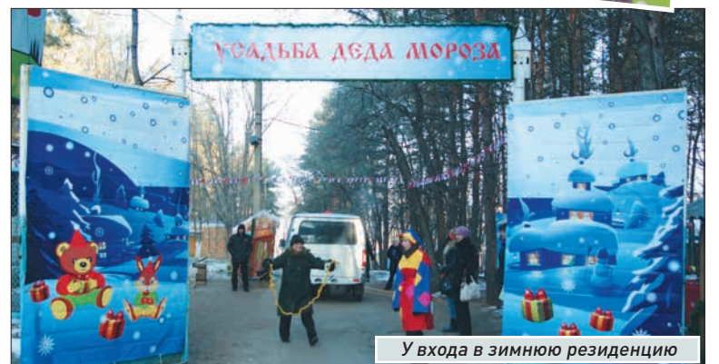
У входа в зимнюю резиденцию