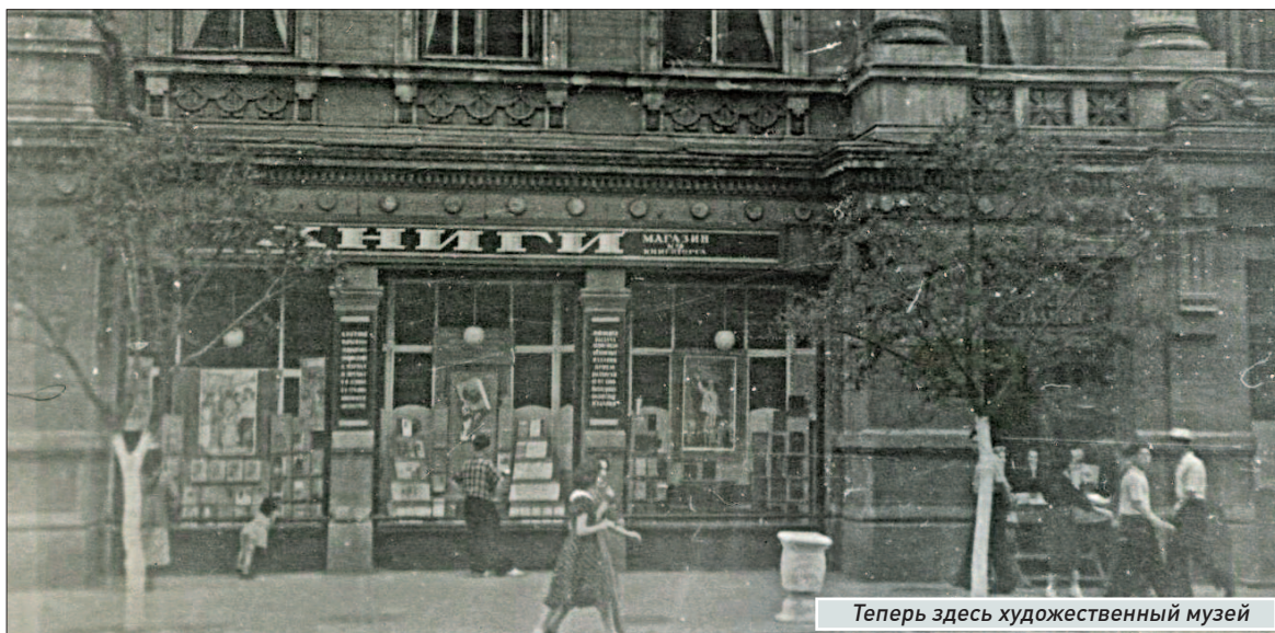
Теперь здесь художественный музей

ла: «Жила, живу и жить буду!» и предъявила все имеющиеся документы, подтверждающие обоснованность ее действий.