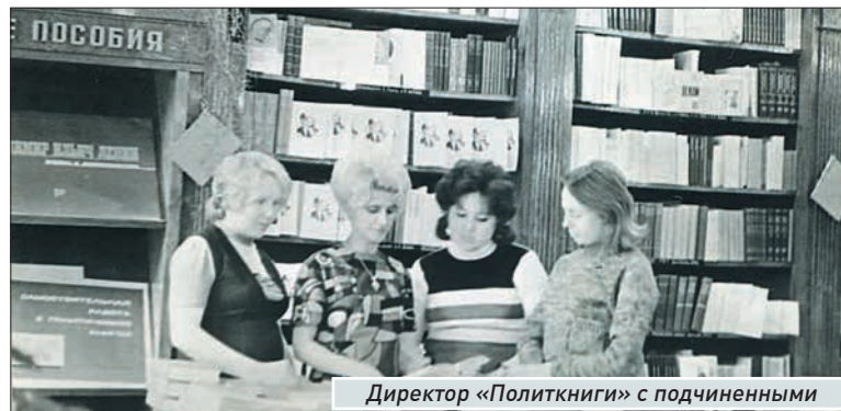
Директор «Политкниги» с подчиненными