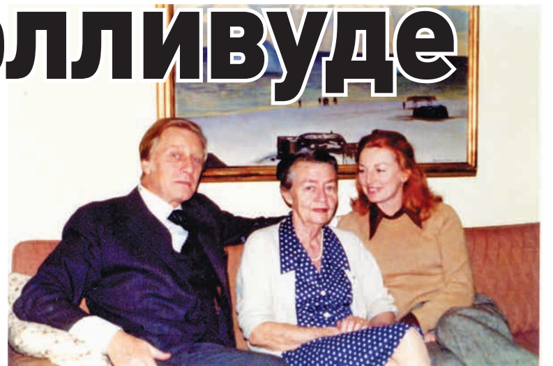
На фоне картины Рокуэллы Кента американский актер Джордж Гейнс (слева), его жена актриса Эллен Энн МакЛери (справа). В центре жена дяди Гейнса, актера Грегори Гайе - Френсес Ли