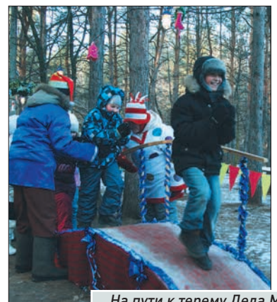
На пути к терему Деда Мороза - неожиданные препятствия!