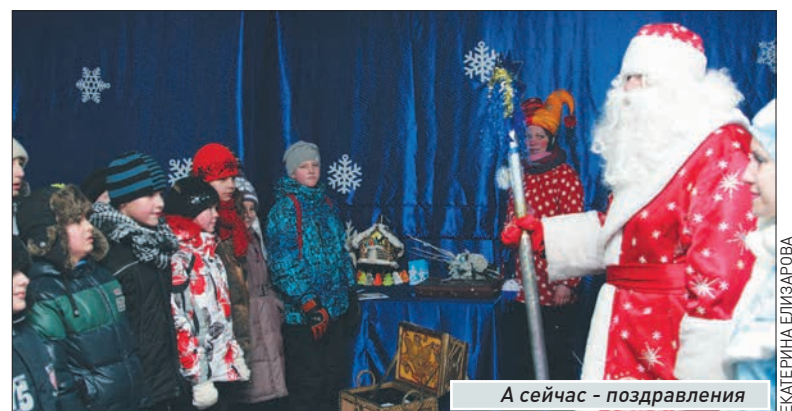
А сейчас - поздравления