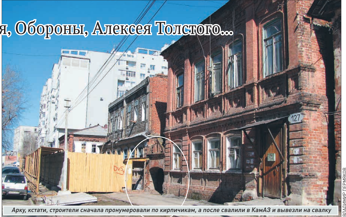
Арку, кстати, строители сначала пронумеровали по кирпичикам, а после свалили в КамАЗ и вывезли на свалку

Той же осенью 42 года мы уехали в Мелекес (сегодня - Димитровград) к бабушке, матери мамы. В Куйбышев вернулись в