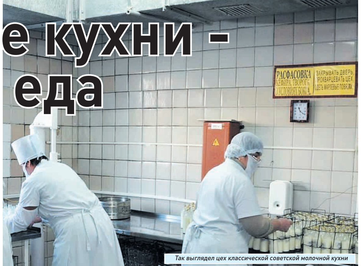
Так выглядел цех классической советской молочной кухни

Давайте только представим: настоящая молочная продукция высочайшего качества. Не «продукт творожный», а настоящий творог. Не «молочный продукт», а кефир - с настоящими живыми бактериями внутри (особо впечатлительных просим не читать). Бактерии настолько живые, что если им дадут ненастоящее молоко, то они просто не будут образовывать стусток - погибнут геройской смертью в борьбе за здоровье потребителя. Но если молоко хорошее, то на первый