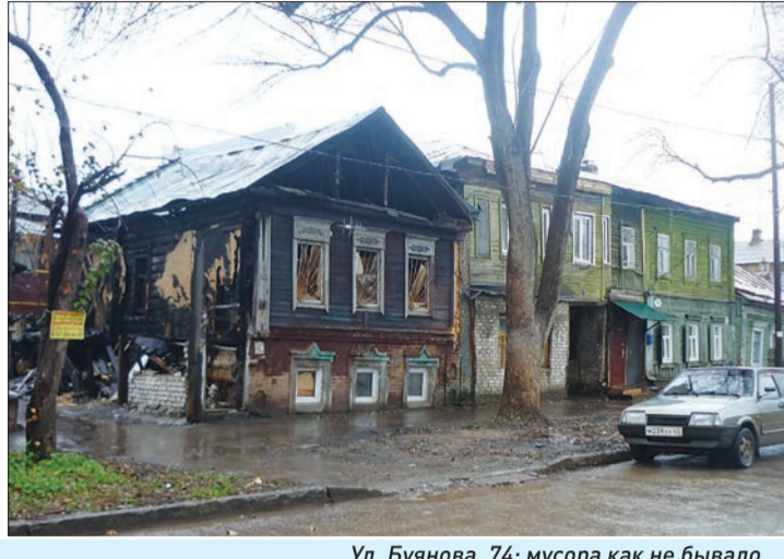
Ул. Буянова, 74: мусора как не бывало