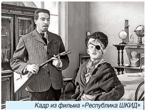
Кадр из фильма «Республика ШКИД»

«И будут вежливы и ласковы настолько - Предложат жизнь счастливую на блюде.»