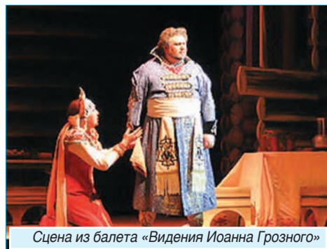
Сцена из балета «Видения Иоанна Грозного»