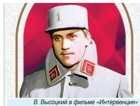
В. Высоцкий в фильме «Интервенция»