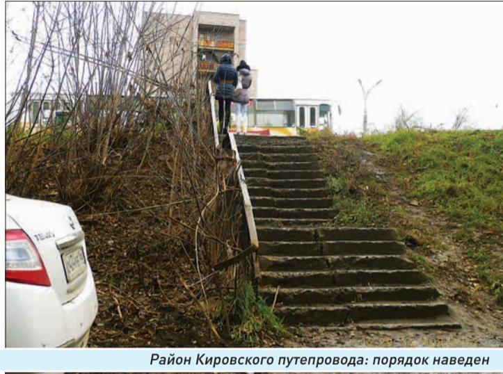
Район Кировского путепровода: порядок наведен