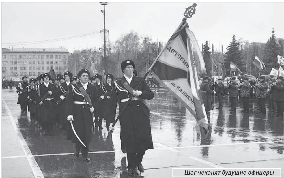
Шаг чеканят будущие офицеры