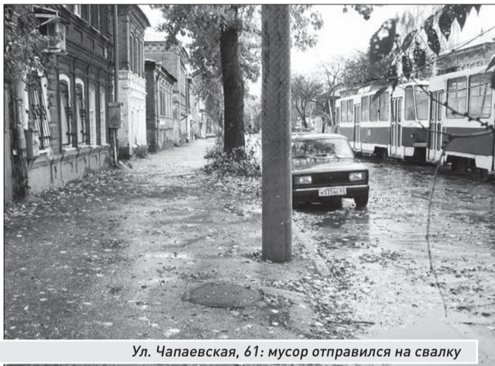
Ул. Чапаевская, 61: мусор отправился на свалку