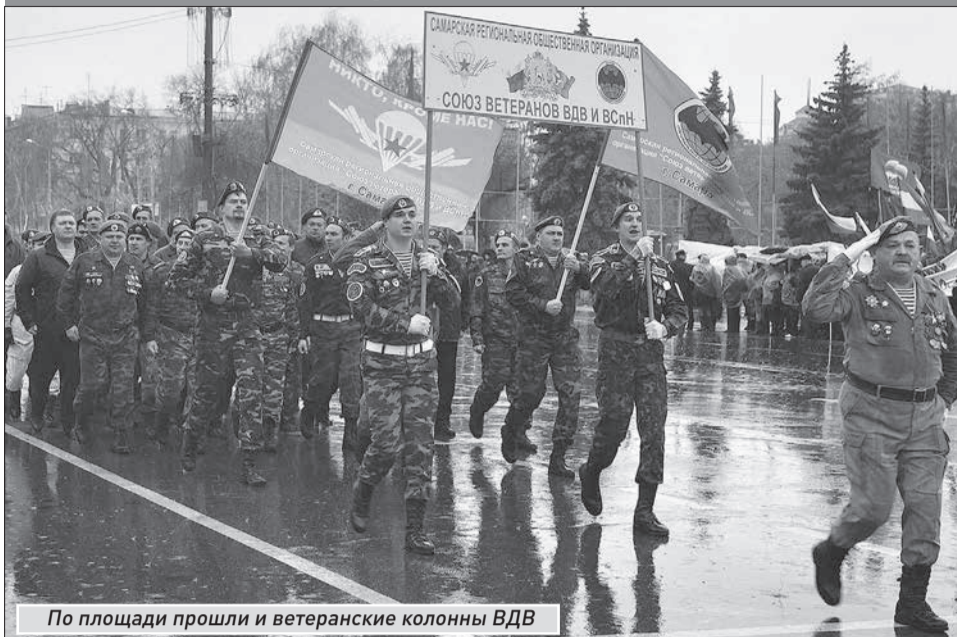
По площади прошли и ветеранские колонны ВДВ

ЧЕТВЕРГ | 8 ноября 2012 года | №205 (4982)