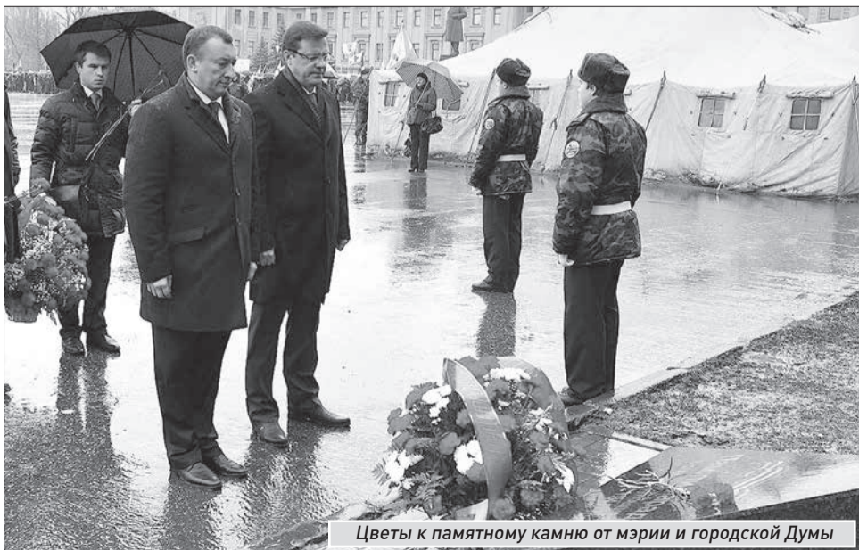
Цветы к памятному камню от мэрии и городской Думы