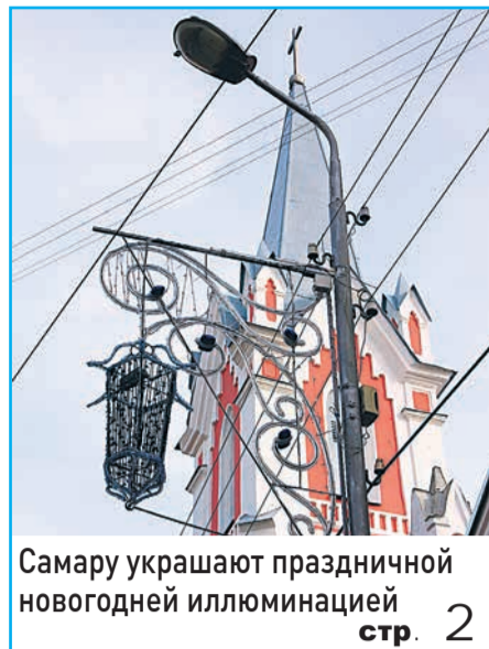
Самару украшают праздничной новогодней иллюминацией стр. 2