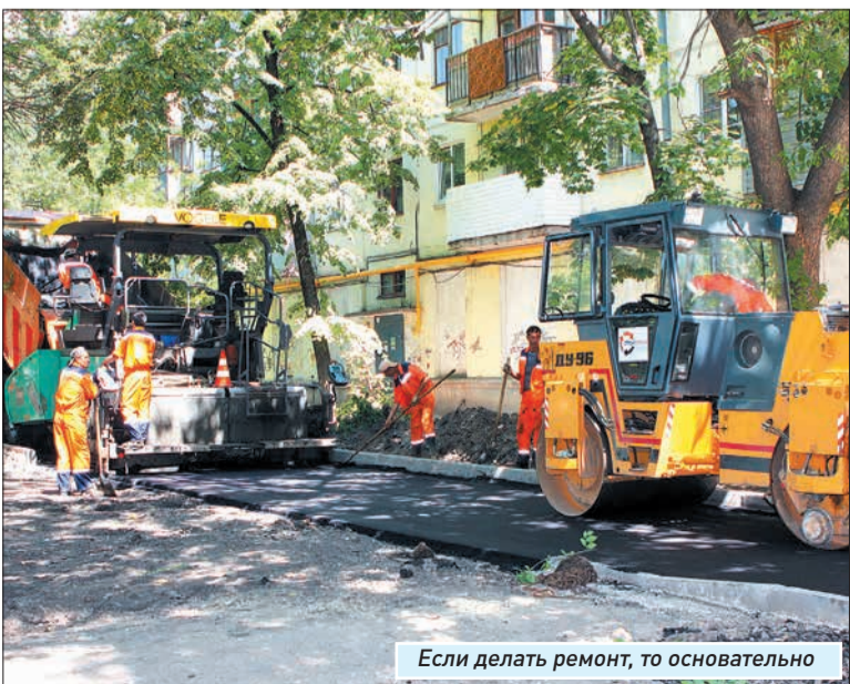
Если делать ремонт, то основательно