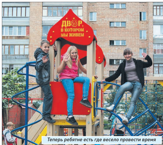
Теперь ребятам есть где весело провести время