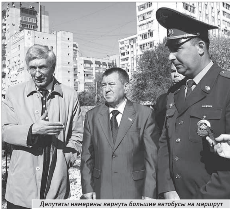
Депутаты намерены вернуть большие автобусы на маршрут

Второй вариант - расширение подъездных полос к перекрестку, чтобы здесь вновь могли проезжать большие автобусы, но для этого потребуется перенести близлежащие торго-