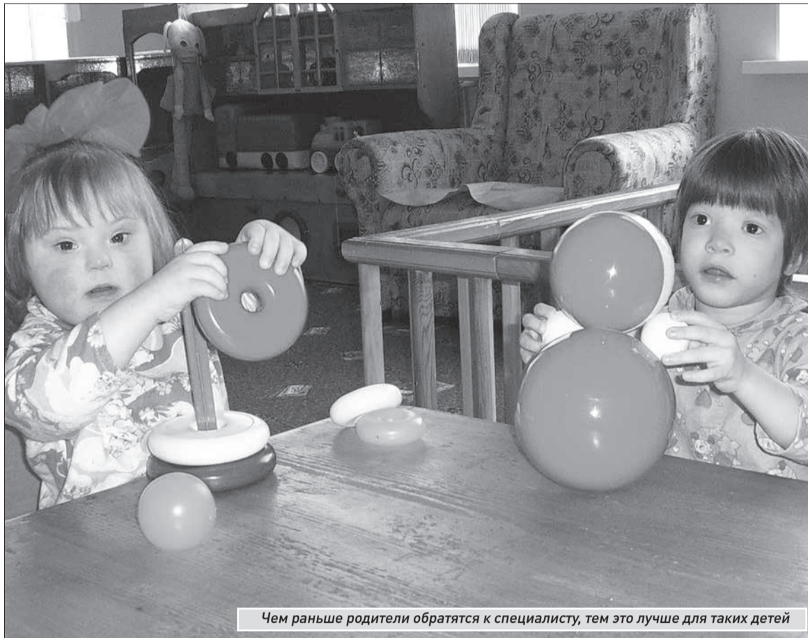
Чем раньше родители обратятся к специалисту, тем это лучше для таких детей

- В западных странах к специалисту обращаются гораздо раньше, чем в нашей. Первое предъявление ребенка логопеду происходит, когда ему едва исполнится шесть месяцев. Малыш еще не говорит, а специалист по речи должен его обязательно посмотреть. Делается это вот с какой целью. Речь как надстройка в центральной нервной системе формируется посредством определенных структур созревания мозга, и не в один день. Суще-