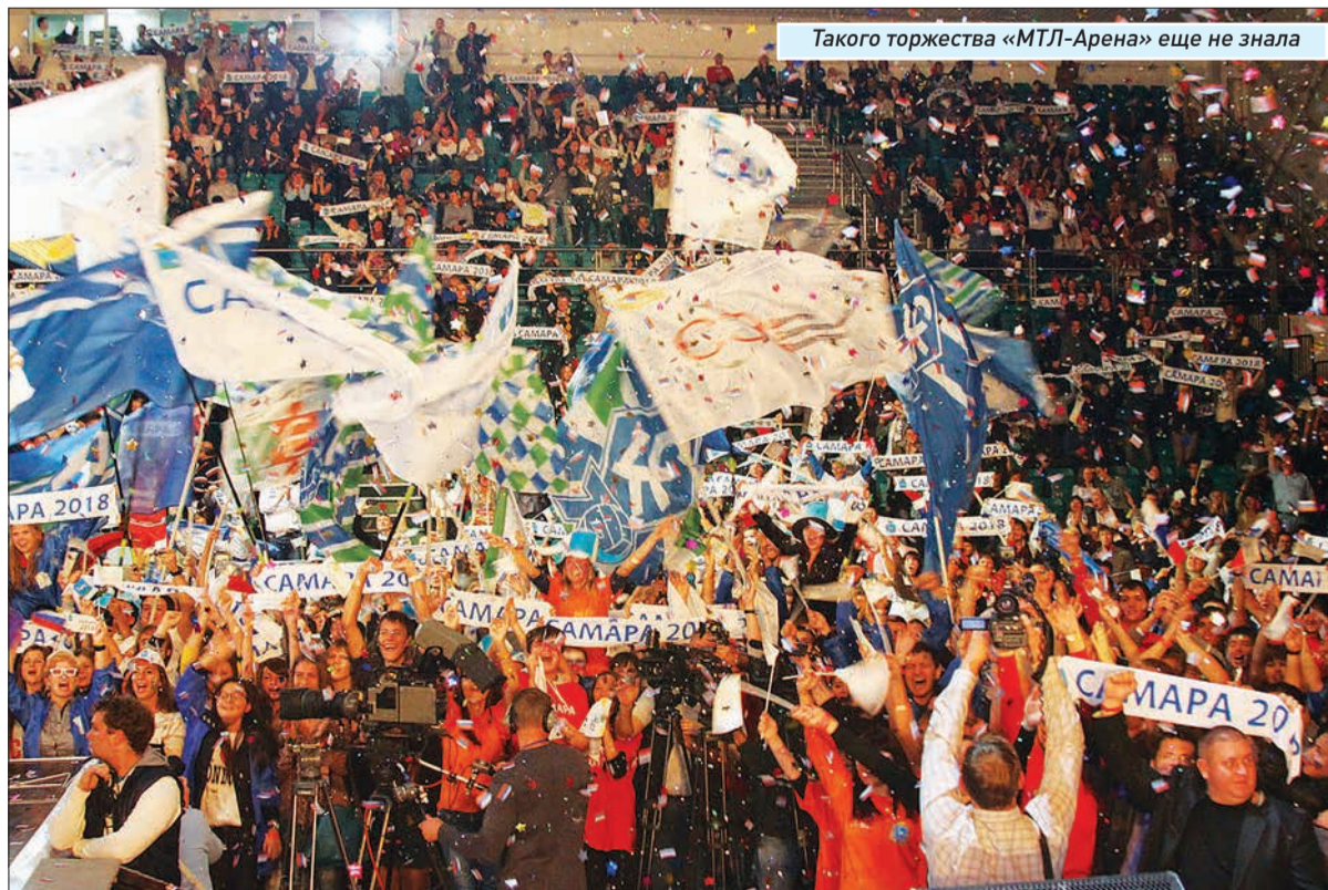
Такого торжества «МТЛ-Арена» еще не знала

Москва, Санкт-Петербург, Сочи, Казань, Екатеринбург, Калининград, Нижний Новгород, Самара, Волгоград, Ростов-на-Дону, Саранск.