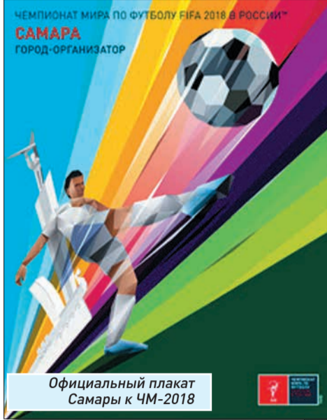
Официальный плакат Самары к ЧМ-2018

- Мы уверены, что проведение матчей чемпионата мира дает Самаре шанс выйти на качественно новый