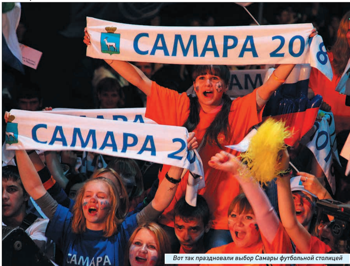
Вот так праздновали выбор Самары футбольной столицей

- Мы победили! Мы будем двигаться вперед вместе со страной. Самара - вперед! Россия - вперед! Самарцы благодарны ФИФА за поддержку, - говорит Николай Меркушкин. - Выбор в пользу Самары окрыляет и дает дополнительный стимул для нас. Можете не сомневаться - мы не подведем и сделаем все, чтобы провести футбольный чемпионат лучше всех в России. Мы умеем это делать!