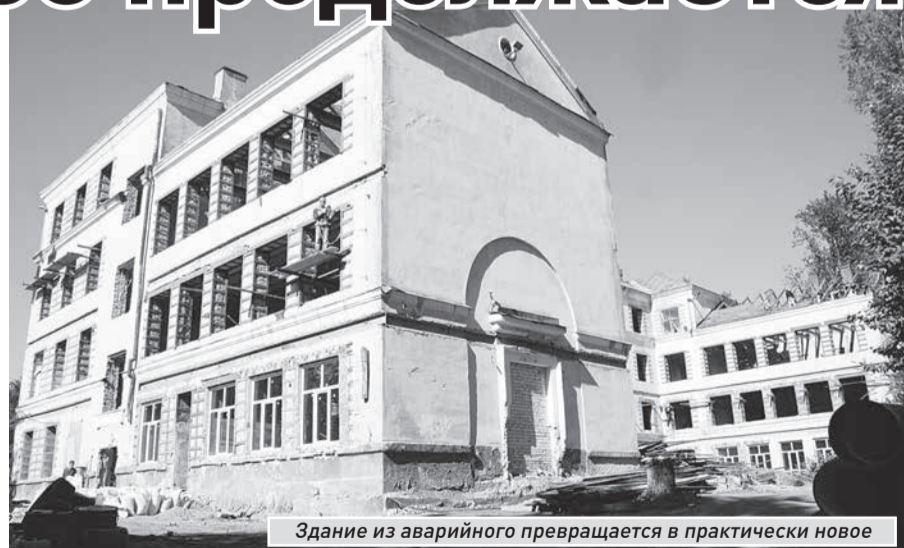
Здание из аварийного превращается в практически новое

В осенне-зимний период в здании планируется провести внутреннюю отделку помещений. Впрочем, она уже началась. Строители ровняют и штукатурят стены, настилают полы. Согласно графику, компания-подрядчик - ООО «Вест» - покинет отремонтированное здание в мае-июне будущего года. За три летних месяца городской департамент образования должен обустроить школу, подготовить ее к приему учеников, которые вернутся в родные стены 1 сентября следующего года.