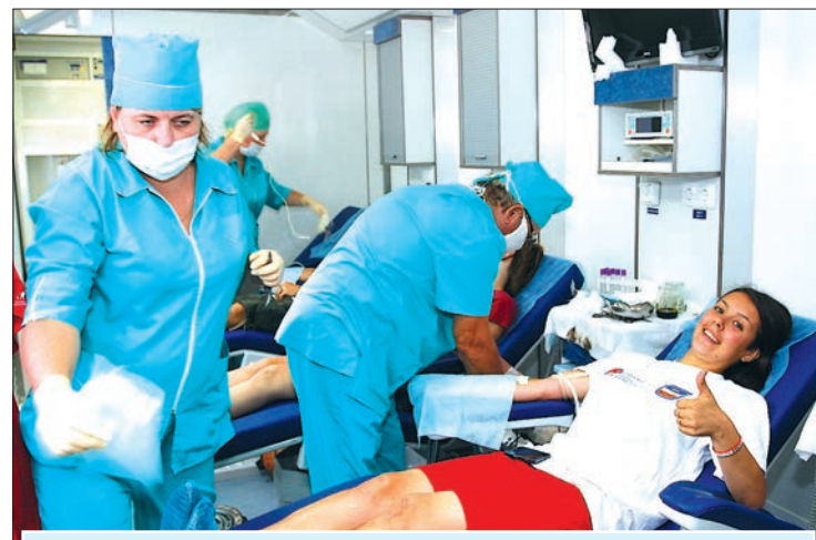
В мобильных центрах кровь можно было сдать и на сахар, и просто... поделиться ею с человечеством

Порядка 22-х миллионов человек в стране страдают от гипертонической болезни.