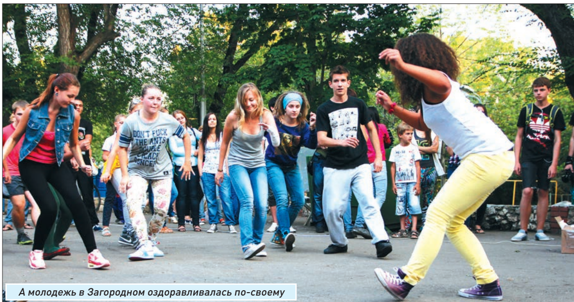
А молодежь в Загородном оздоравливалась по-своему

- Проблема борьбы за здоровый образ жизни не только общероссийская, но и всего мира. К сожалению, пока массового движения в обществе в эту сторону я не вижу. Даже центры здоровья создавались прежде всего для людей здоровых, где они могли бы узнать о факторах риска развития своих заболеваний. Ведь тот же сахарный диабет второго типа начинается не сразу. И есть школы здоровья, где человеку объясняют, как надо, например, скорректировать свое питание. К сожалению, мало кто отказывается от своих привычек. Цель подобной акции в том, чтобы люди знали и видели, что можно сделать для своего здоровья. Поэтому и Лео Бокерия вышел в народ, чтобы привлечь внимание к тому, что наше здоровье - в наших руках. Но людям проще проглотить таблетку, чем нагрузить себя физкультурой, ходьбой. «Реализуй себя на сто процентов» - к этому девизу должны стремиться и сами врачи. Нужно активно жить и перестраивать нашу систему так, чтобы мы, медики, могли чаще разговаривать с пациентом, убеждать его на собственном примере.