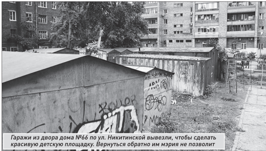
Гаражи из двора дома №66 по ул. Никитинской вывезли, чтобы сделать красивую детскую площадку. Вернуться обратно им мэрия не позволит

Наряду с решением проблемы незаконной торговли мэрия приступит к вывозу самовольно установленных гаражей. Дом молодежи, благоустроенный по городской программе двор дома № 66 по улице Никитинской и улица Солнечная (из-за ее реконструкции гаражи «переехали» во дворы, в том числе и очень близко к школе) - эти точки звучат в последних обращениях жителей. «Сама по себе эта проблема не решится. Нужно выработать правовой алгоритм совместной работы с прокуратурой и полицией, аналогичный тому, который мы применяем при вывозе незаконных киосков», - подчеркнул Дмитрий Азаров .