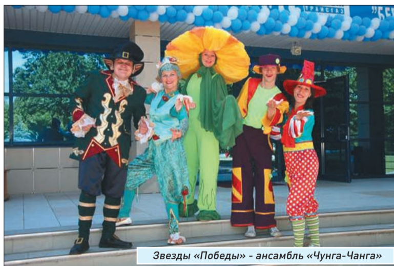
Звезды «Победы» - ансамбль «Чунга-Чанга»