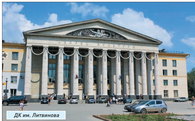
ДК им. Литвинова

Основной проблемой учреждения является удручающий вид фасада здания, интерьера зрительного зала, ветхость посадочных мест. Необходимы преобразования в техническом плане, в частности, установка современного звукового и светового оборудования.