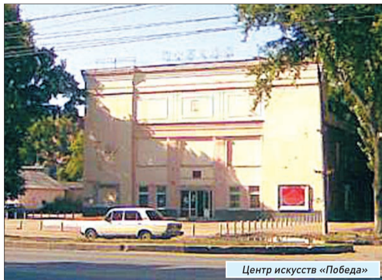
Центр искусств «Победа»

Массовое развитие подобных клубных учреждений началось в СССР с ноября 1920 года, когда Декретом Совнаркома в системе Наркомпроса РСФСР был образован Главполитпросвет. Российские народные дома, появившиеся со второй половины 1880-х годов, были преобразованы тогда в рабочие клубы и Дома культуры. Первым Дворцом культуры ВЦСПС (впервые в стране возведенным на средства профсоюзов, к юбилейной дате 8 ноября 1927 года) стал Дворец культуры имени М. Горького в Ленинграде. Первые дворцы и дома пионеров и школьников в СССР были открыты в 1923-1924 годах в Москве.