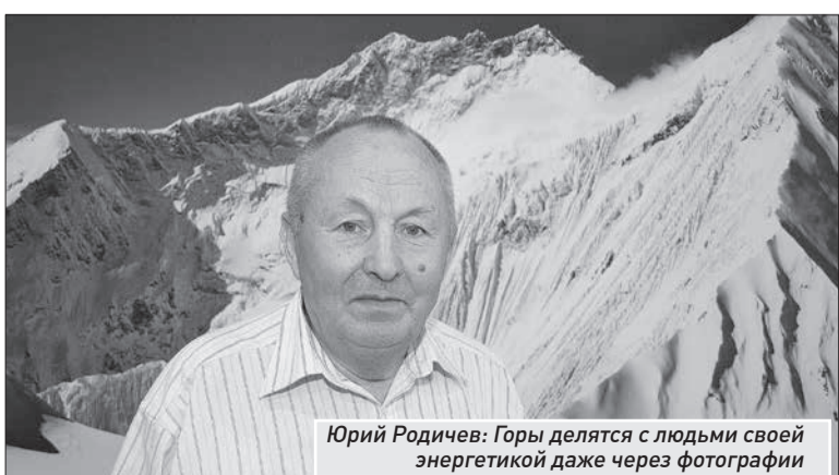
Юрий Родичев: Горы делятся с людьми своей энергетикой даже через фотографии