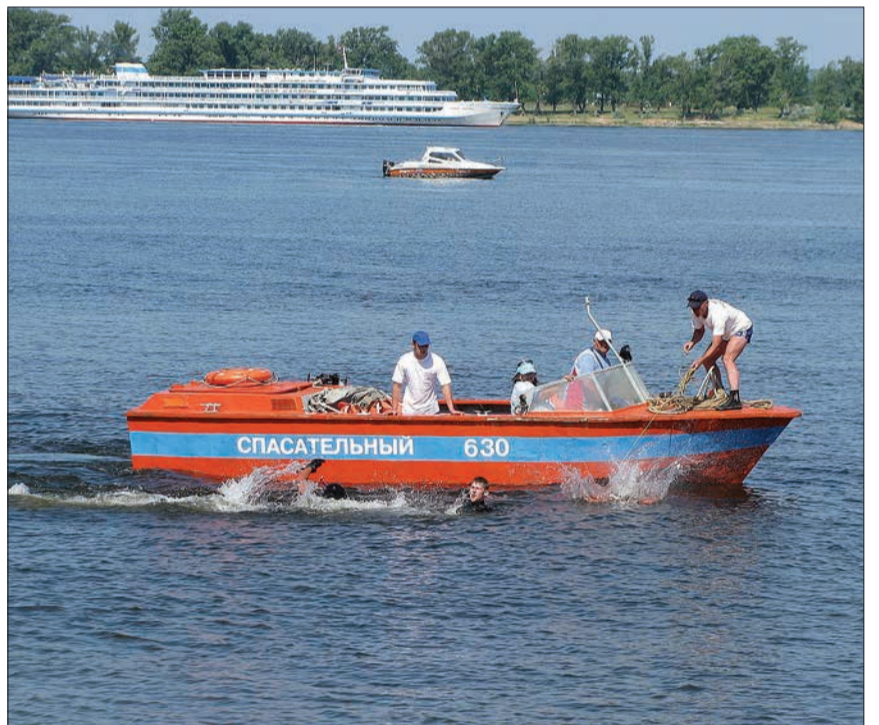
Будни спасателей: ни минуты покоя