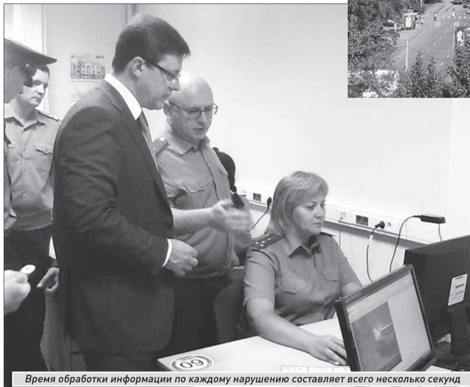
Время обработки информации по каждому нарушению составляет всего несколько секунд