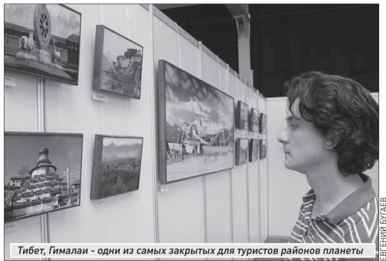
Тибет, Гималаи - одни из самых закрытых для туристов районов планеты

Выставка «Гималаи. Тибет» в Самарском областном краеведческом музее имени Петра Алабина продлится до 26 августа.