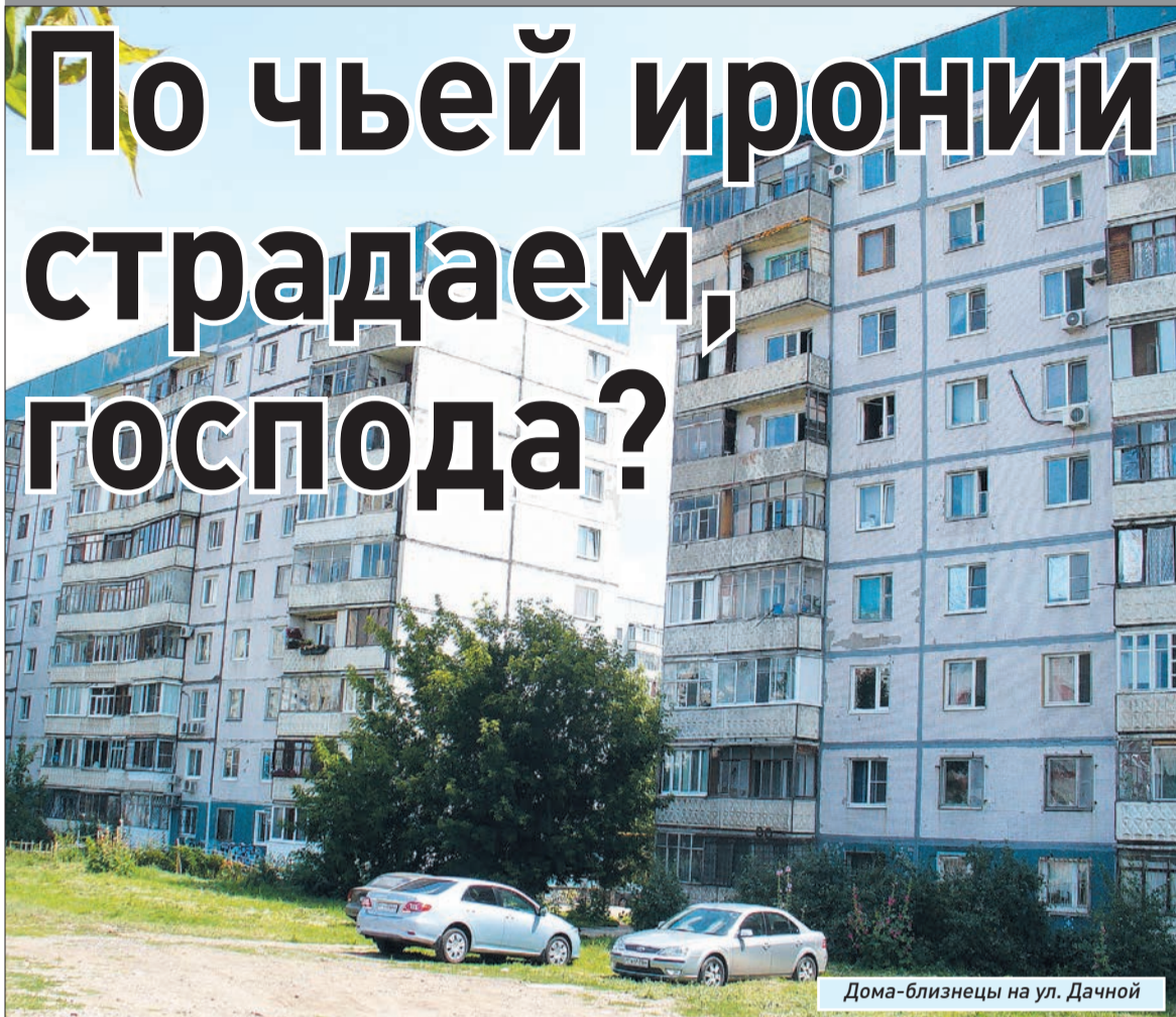
Дома-близнецы на ул. Дачной