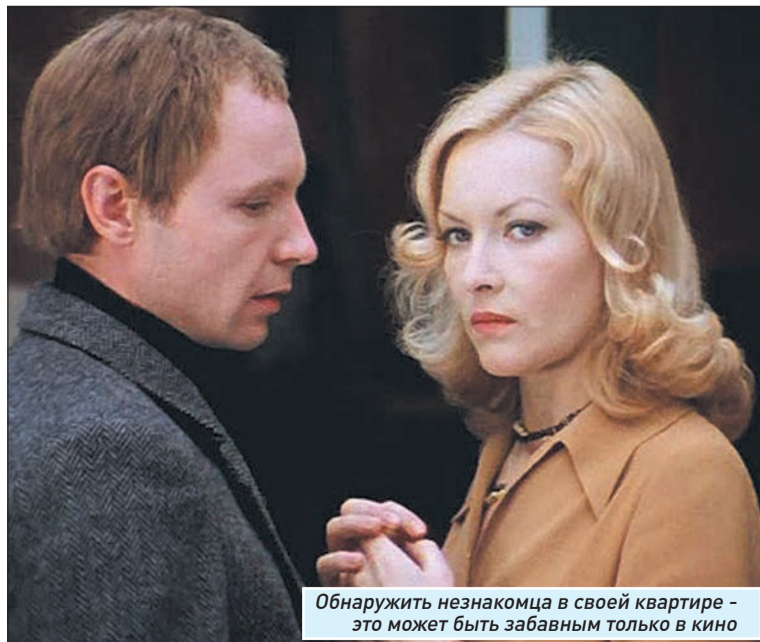
Обнаружить незнакомца в своей квартире - это может быть забавным только в кино

Какая досада, вас оставили с тяжеленным шкафом в чужой подворотне? А вы, как всегда, пытаетесь все списать на иронию судьбы? Не торопитесь. Гораздо важнее, думаю, знать: по чьей иронии страдаем, господа?