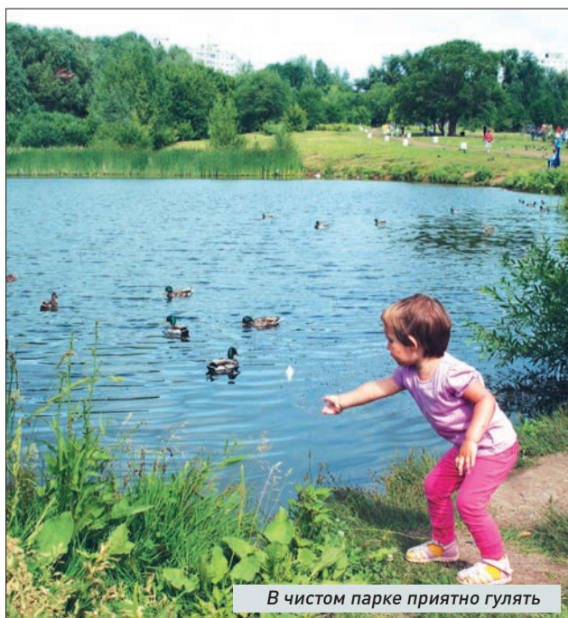
В чистом парке приятно гулять

На контейнерной площадке рядом с домом №35 по улице Гагарина часто скапливается строительный мусор. К сожалению, крупногабаритные отходы отсюда вывозятся не так часто, как это необходимо. После публикации в «СГ» ситуация изменилась в лучшую сторону. Сегодня рядом с контейнерами больше нет хлама.