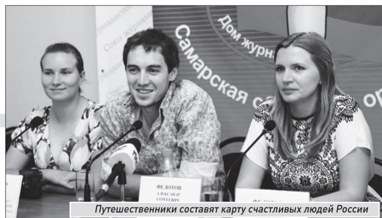
Путешественники составят карту счастливых людей России