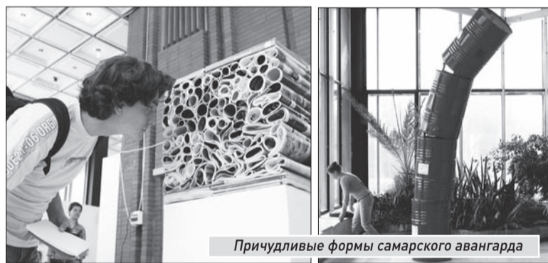
Причудливые формы самарского авангарда