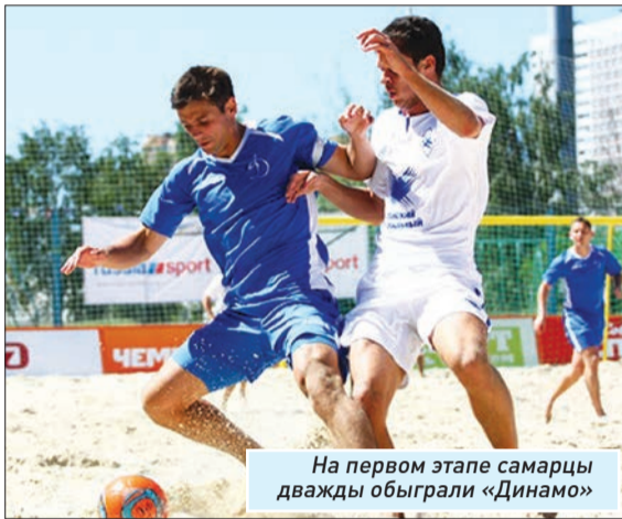
На первом этапе самарцы дважды обыграли «Динамо»

Победителем же сенсационно стал санкт-петербургский «Кристалл», в финальном матче переигравший хозяев турнира ФК «Строгино» - 6:5.