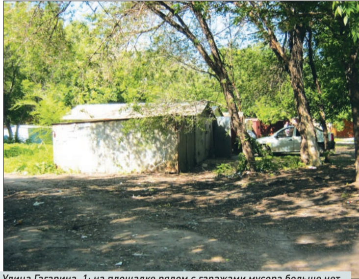
Улица Гагарина, 1: на площадке рядом с гаражами мусора больше нет