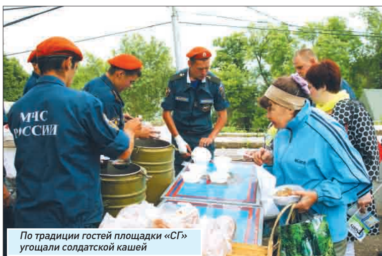
По традиции гостей площадки «СГ» угощали солдатской кашей

Газета «Право» областного ГУВД на своей площадке дала возможность понаблюдать за фестивалем и окрестностями с высоты птичьего полета: над Струковским садом парил беспилотный аппарат с видеокamerой, а изображение транслировалось на плазменном экране. А на площадке ГТРК ведущие радиостанции «Маяк» принимали поздравление с 85-летием и угощали гостей праздничным тортом.