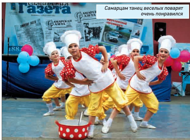
Самарцам танец веселых поварят очень понравился