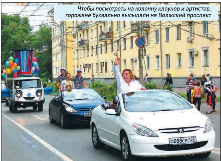
Чтобы посмотреть на колонну клоунов и артистов, горожане буквально высыпали на Волжский проспект

Лариса ДЯДЯКИНА Александр КЕДРОВ Анна ШАЙМАРДАНОВА