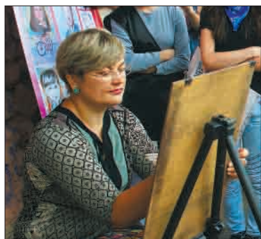
Каждый желающий мог бесплатно получить шарж на себя или сфотографироваться с ростовыми куклами