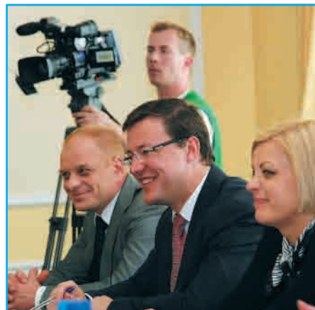
Глава Самары Дмитрий Азаров встретился с бизнес-делегацией из города-побратима Стара-Загора стр. 2

курс валют сегодня | $ 31.82 | € 40.11 | погода на завтра gismeteo.ru | День | +25 | пасмурно ветер ЮЗ, 1 м/с | давление 749 влажность 40% | Ночь | +15 | малооблачно ветер ЮЗ, 3 м/с | давление 748 влажность 44%