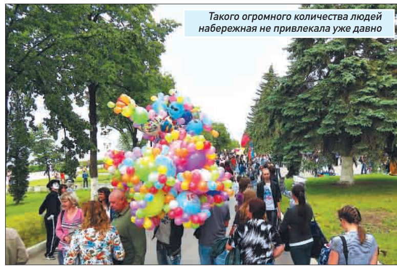
Такого огромного количества людей набережная не привлекала уже давно