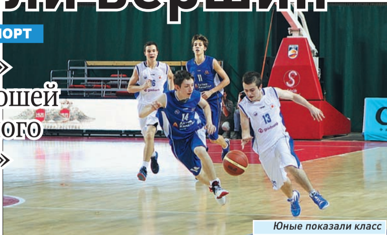
Юные показали класс

Ребята за короткий период добились многого. В первенстве России, финал которого проходил в Самаре, заняли второе место, а по итогам Европейской юношеской баскетбольной лиги (Швеция) стали бронзовыми призерами.