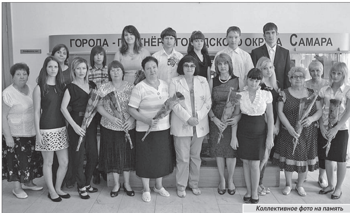
Коллективное фото на память