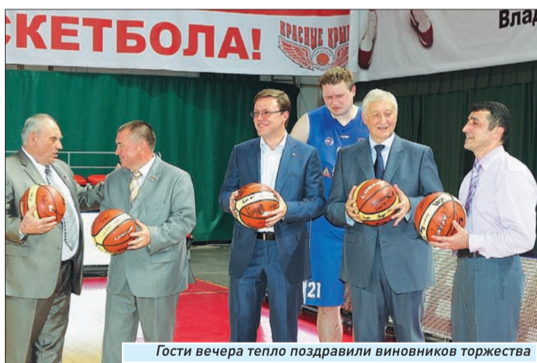
Гости вечера тепло поздравили виновников торжества

VIP-гостей не отпустили просто так. Им подарили мячи с автографами игроков баскетбольного клуба. Мероприятие завершилось всеобщей фотосессией.