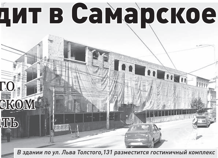
В здании по ул. Льва Толстого, 131 разместится гостиничный комплекс

В минувшую субботу прошли очередные публичные слушания. Жители рассказали о четырёх новых объектах, которые могут появиться в Железнодорожном и Куйбышевском районах.