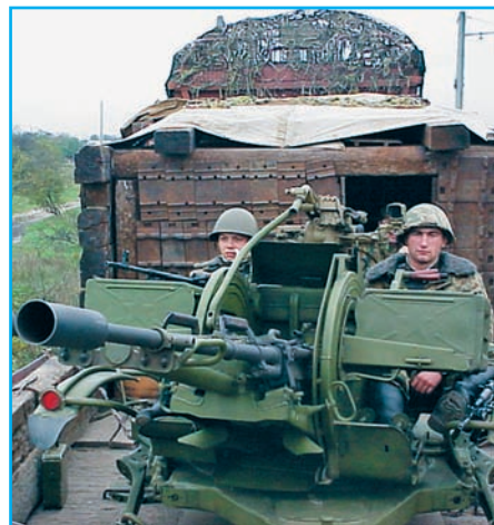
Крепость на колёсах. Бронепоезд на чеченской войне стр. 6

курс валют сегодня | $ 31.06 | € 39.73 | погода на завтра gismeteo.ru | День | +18 | пасмурно, дождь, ветер С-В, 7 м/с | давление 748 влажность 58% | Ночь | +15 | пасмурно, ветер С-В, 6 м/с | давление 749 влажность 53%