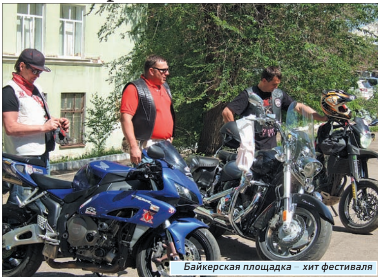
Байкерская площадка – хит фестиваля