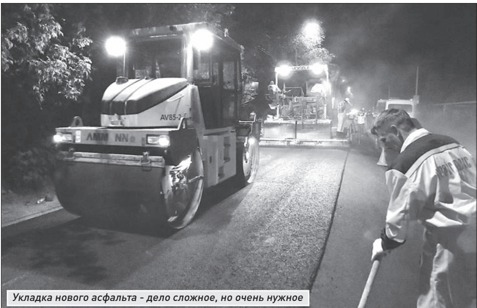
Укладка нового асфальта - дело сложное, но очень нужное

ского шоссе у поста ГАИ дорогу только готовили к ремонтным работам. Фреза снимала старый асфальт – до 10 см, рабочие собирали его куски лопатами и бросали в ковш. После этого на магистраль уложат геосетку для прочности покрытия, затем два слоя асфальта – выравнивающий и верхний.