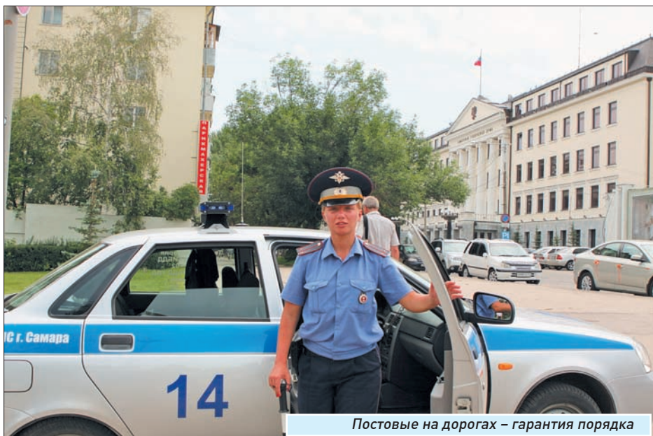
Постовые на дорогах - гарантия порядка

Задать свой вопрос сотрудникам Госавтоинспекции вы можете на нашем сайте: www.sgpress.ru и по телефону редакции «СГ»: 979-75-84