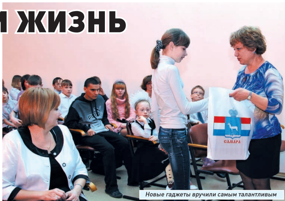
Новые гаджеты вручили самым талантливым

Ребята считают, что Мишин подарок будет им хорошим подспорьем в дальнейшей учебе не только в школе, но и после ее окончания.