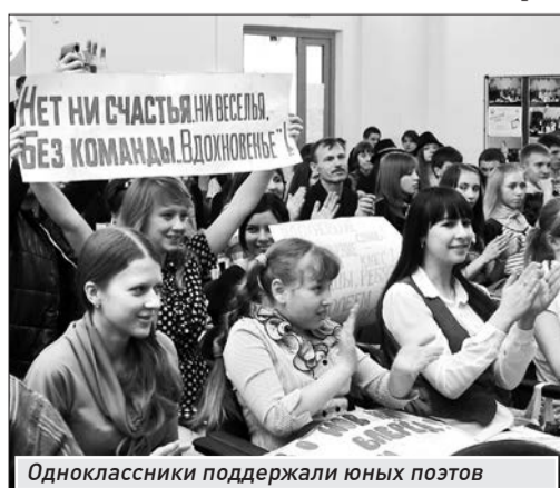
Одноклассники поддержали юных поэтов