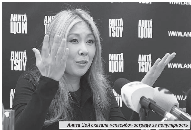
Анита Цой сказала «спасибо» эстраде за популярность