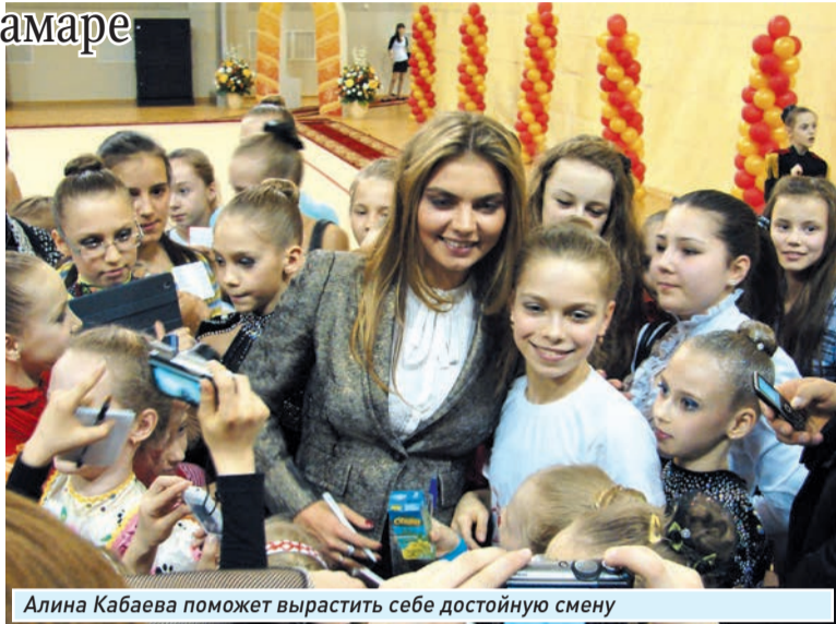
Алина Кабаева поможет вырастить себе достойную смену

Я с удовольствием приняла предложение провести всерос-