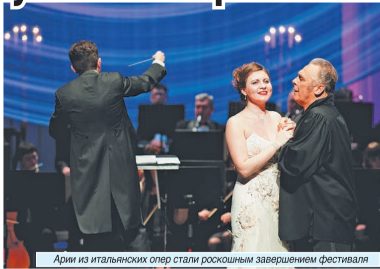
Арии из итальянских опер стали роскошным завершением фестиваля