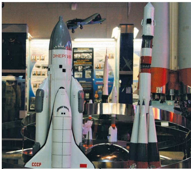
Космический челнок «Буран» на ракете «Энергия»

- Подшипники в космическом корабле используются также в системе управления. Это изделия, которые во время полета корабля в открытом космосе позволяют направлять сопло двигателя и тем самым ориентировать корабль в пространстве, в нуж-