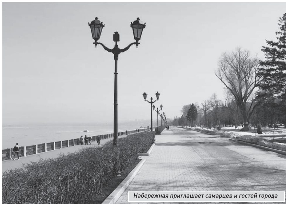
Набережная приглашает самарцев и гостей города