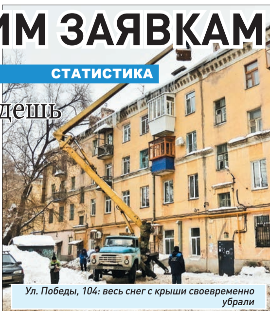
Ул. Победы, 104: весь снег с крыши своевременно убрали

И на ул. Фадеева, по наблюдениям граждан, отныне не так скользко: пешеходные дорожки посыпали песком, а снег вывезли.