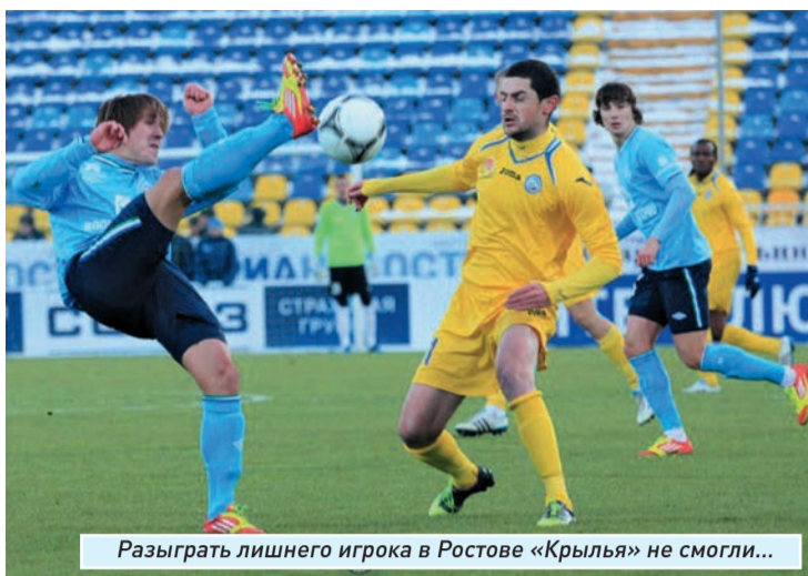
Разыграть лишнего игрока в Ростове «Крылья» не смогли...