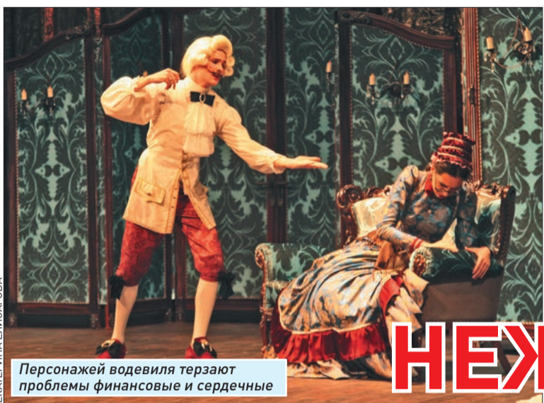
Персонажей водевиля терзают проблемы финансовые и сердечные