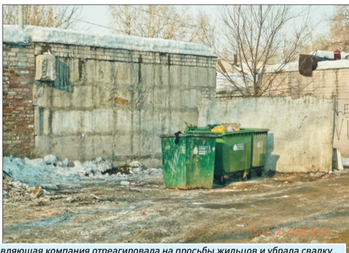
Ул. Краснодонская, 35: управляющая компания отреагировала на просьбы жильцов и убрала свалку, которая появилась рядом с контейнерной площадкой