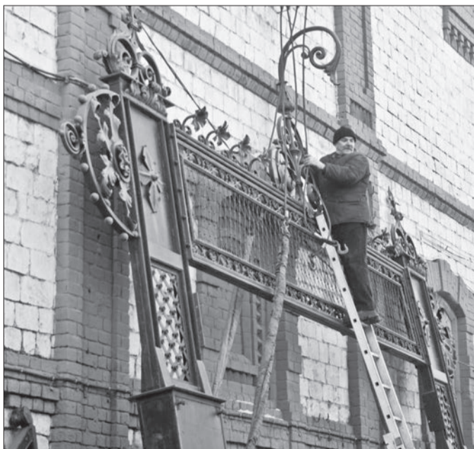
Вместо ворот сразу поставили временное ограждение

щели в оконных и дверных проемах; выполнение работ по подготовке системы отопления дома к сезонной работе не в полном объеме; конструктивные нарушения в работе системы отопления дома; нарушения, допущенные в ходе эксплуатации системы отопления дома как работниками обслуживающей (управляющей) организации, так и жильцами; месторасположение источника тепла.