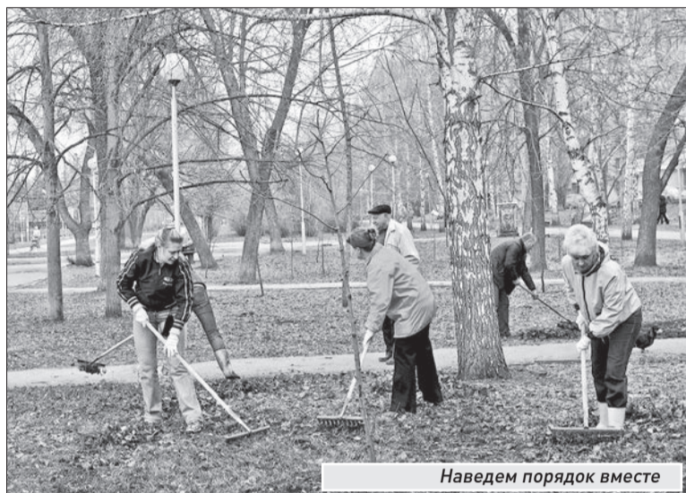
Наведем порядок вместе

В этом году на месячник направят больше средств, чем в прошлом, - 50 млн руб. Кроме того, дополнительные суммы выделены на утилизацию отходов