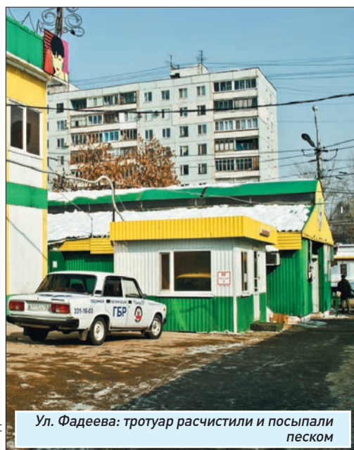
Ул. Фадеева: тротуар расчистили и посыпали песком