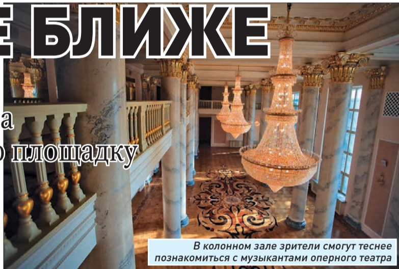
В колонном зале зрители смогут теснее познакомиться с музыкантами оперного театра