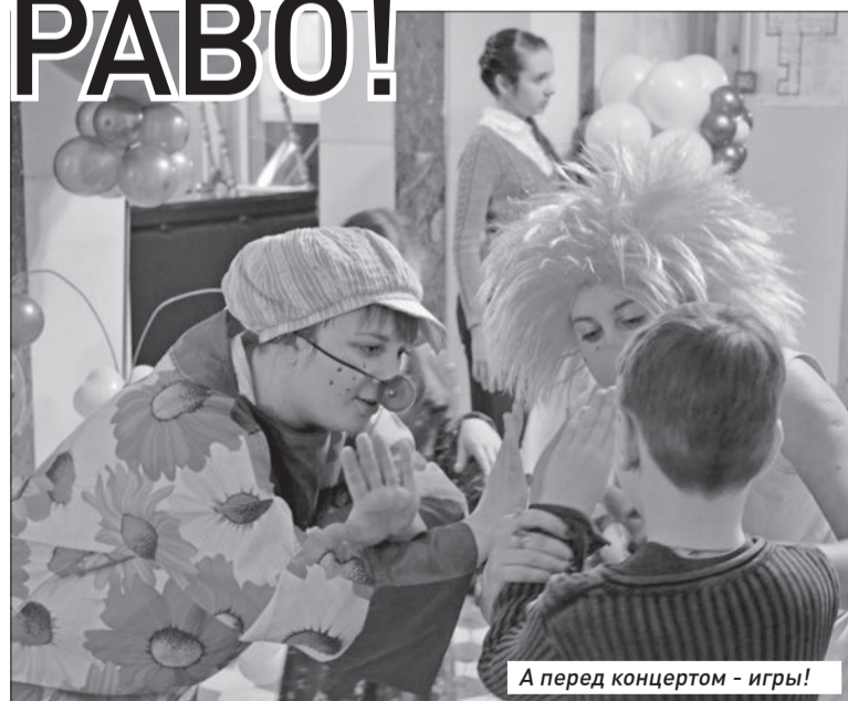
А перед концертом - игры!

Концерт, прошедший на сцене Самарского медико-технического лицея в последнее воскресенье февраля, готовили вместе общественники из социального проекта «Не бойся» и самарский департамент семьи, опеки и попечительства. И это уже не первый опыт их плодотворного сотрудничества. Прошлым ле-