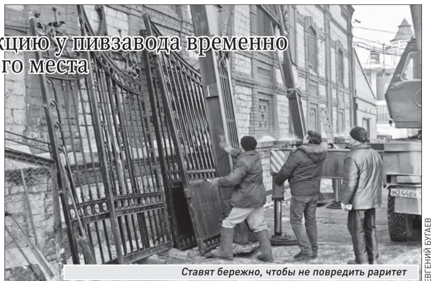
Ставят бережно, чтобы не повредить раритет

Он поспешил нас успокоить: «Ворота вернутся на свое место уже к концу марта. А снять их было необходимо в связи с завозом круп-