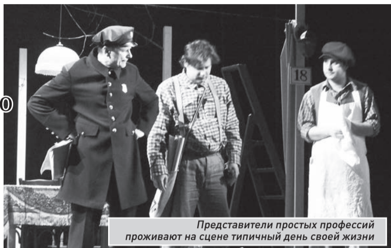
Представители простых профессий проживают на сцене типичный день своей жизни

На сцене две кухни, два палисадника, прямо рядом с ними