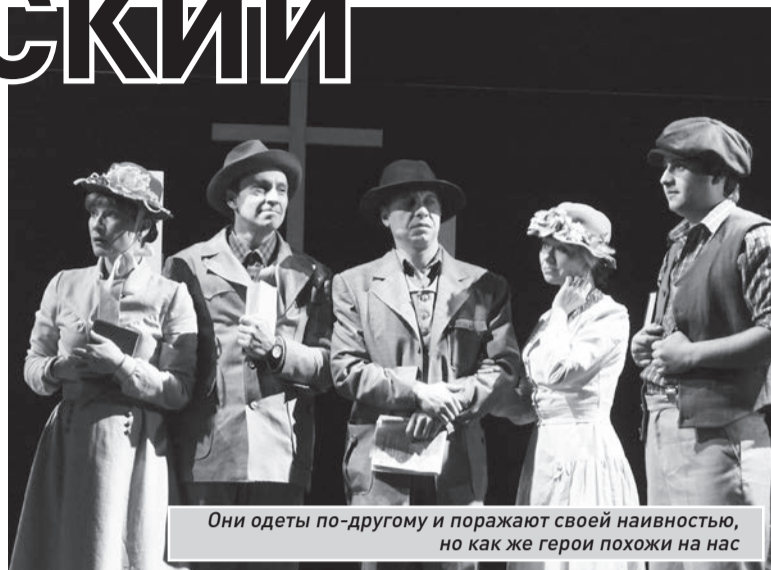
Они одеты по-другому и поражают своей наивностью, но как же герои похожи на нас

Первое действие заканчивается на радостной ноте – влюбленные поженились, все счастливы и веселы. А второе начинается максимально контрастно. Мрачно оформленная сцена, завывание ветра – перед нами кладбище. Умерла главная героиня. Пространство сцены поделено на две части – светлую (умершие герои в светлой одежде сидят на белых стульях) и темную – похоронная процессия. Умиротворение ушедших в мир иной противопоставлено страданиям живых. По мнению Уайлдера, мы погрязли в суете и тревоге, а покой царит в мире,