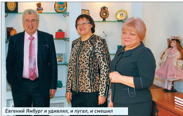
Евгений Ямбург и удивлял, и пугал, и смешил