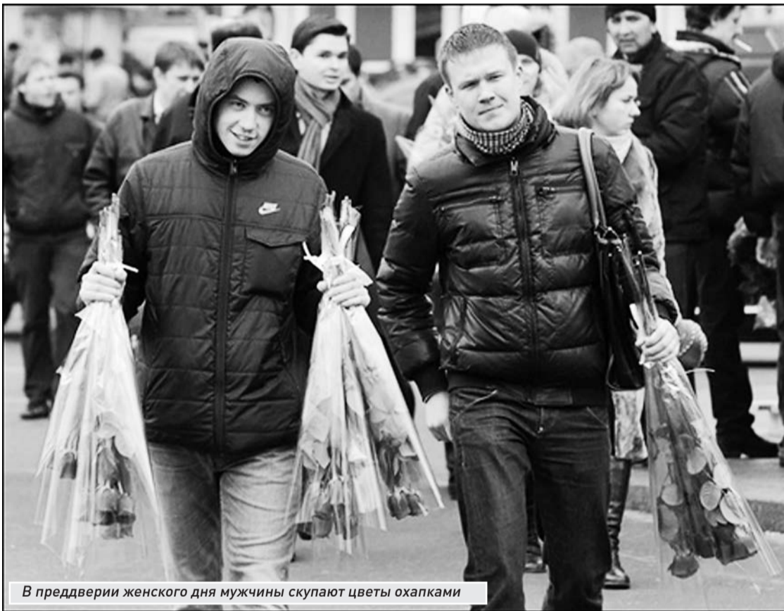
В преддверии женского дня мужчины скупают цветы охапками

А вот 2 марта в Струковском саду и в парке имени Гагарина развесьят оригинальные скворечники. Их смастерили самарские школьники. Часть домиков уже представили на площади им. Куйбышева в минувшее воскресенье, на Масленицу. А в 11.00 на пешеходных улицах Ленинградской и Молодогвардейской начнется шествие духовых оркестров из Самары и Новокуйбышевска.