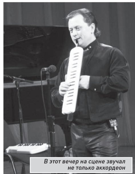
В этот вечер на сцене звучал не только аккордеон