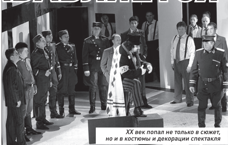
XX век попал не только в сюжет, но и в костюмы и декорации спектакля