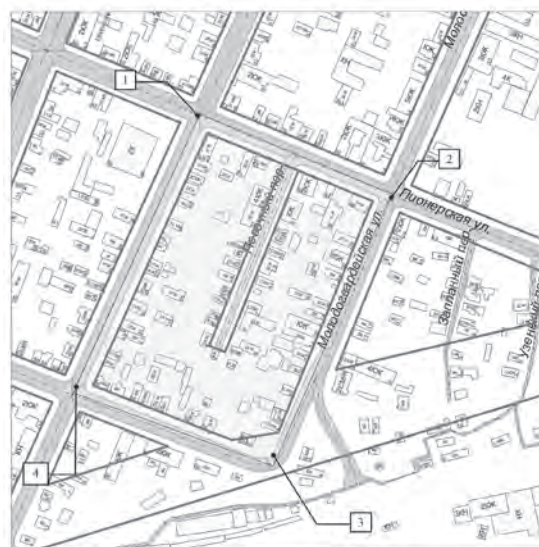
СХЕМА границ территории для подготовки документации по планировке территории в границах улиц Пионерской, Молодогвардейской, Комсомольской, Чапаевской в Самарском районе городского округа Самара

ПРИМЕЧАНИЕ: 1. Графический материал действителен только для определения границ разработки документации по планировке территории.