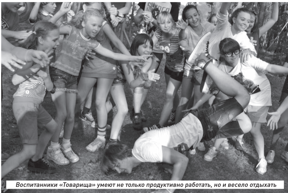
Воспитанники «Товарища» умеют не только продуктивно работать, но и весело отдыхать