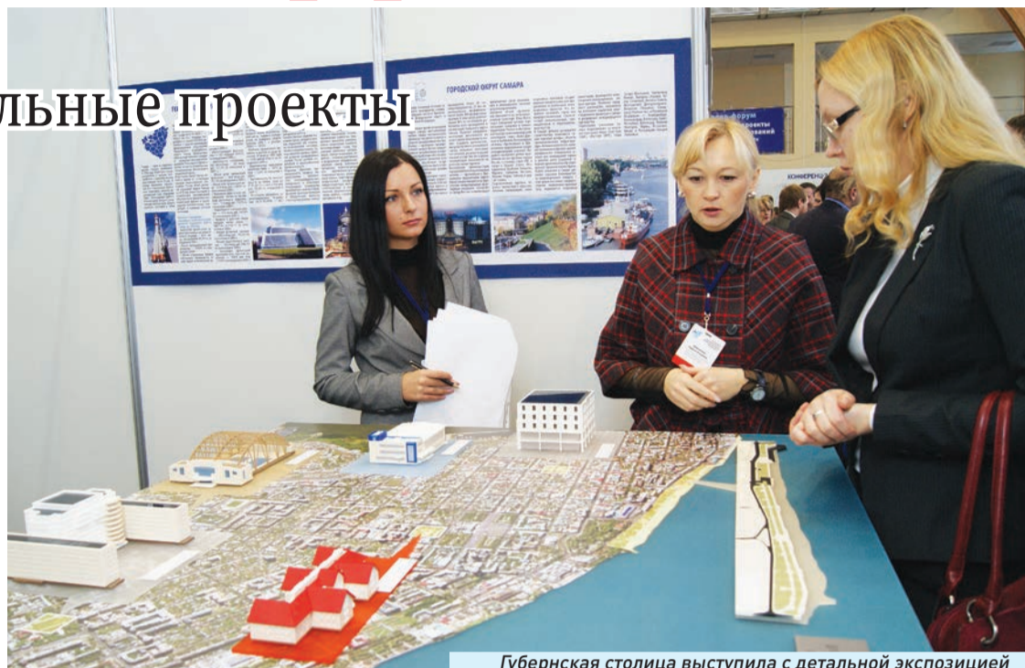
Губернская столица выступила с детальной экспозицией

Еще один проект - реконструкция первого и второго хирургических корпусов городской кли-