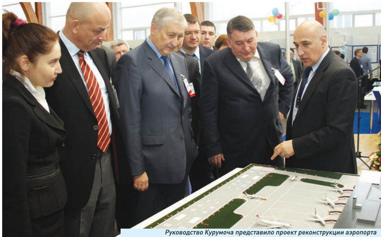
Руководство Курумоча представило проект реконструкции аэропорта

Последний проект - строительство теннисного центра. Эту идею предложили частные инвесторы, задавшись целью - привлечь к занятиям спортом как можно больше людей. За два года они собираются возвести крытые корты с твердым покрытием. Также - все необходимые подсобные помещения, наличие которых сделает отдых комфортным и запоминающимся. Предполагается, что теннисный центр построят в районе парка имени Щорса. Проект обойдется в 12 млн рублей.