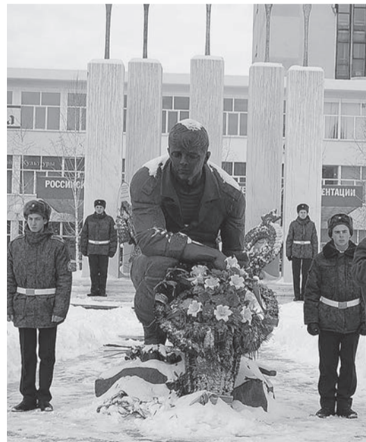
У мемориала на ул. Мичурина - почетный караул