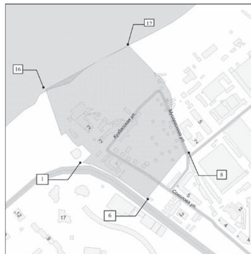
СХЕМА границ территории для подготовки документации по планировке территории в границах улиц Мусоргского, Липецкой, Северо-восточной магистрали, левого берега рек и Волги в Октябрьском районе городского округа Самара